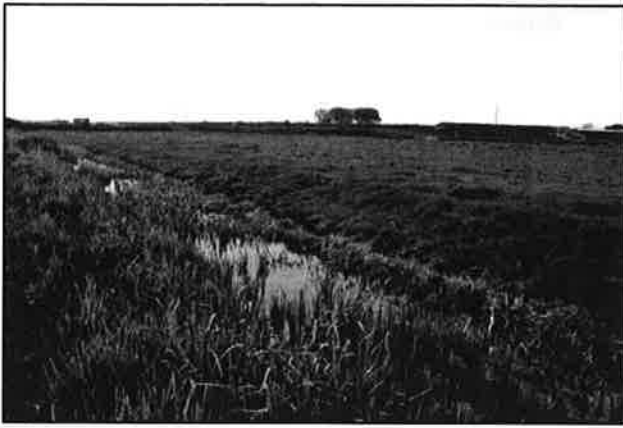
Figuur 4. Deelgebied C