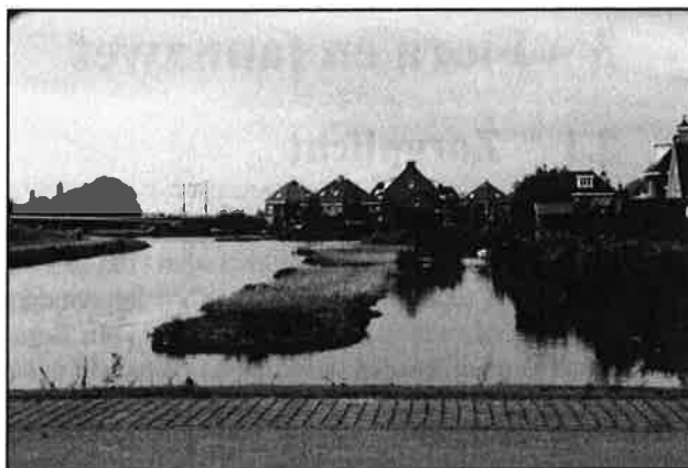
Figuur 2. Gerealiseerde bebouwing in de Westpolder met waterpartijen voorzien van glooiende, natuurlijke oevers.

In oktober 2009 is aan de hand van een veldbezoek de geldigheid van de inventarisatie uit 2003 opnieuw beoordeeld. Op grond van deze nieuwe beoordeling kan besloten worden aanvullend onderzoek te verrichten of voor soorten opnieuw ontheffing aan te vragen.