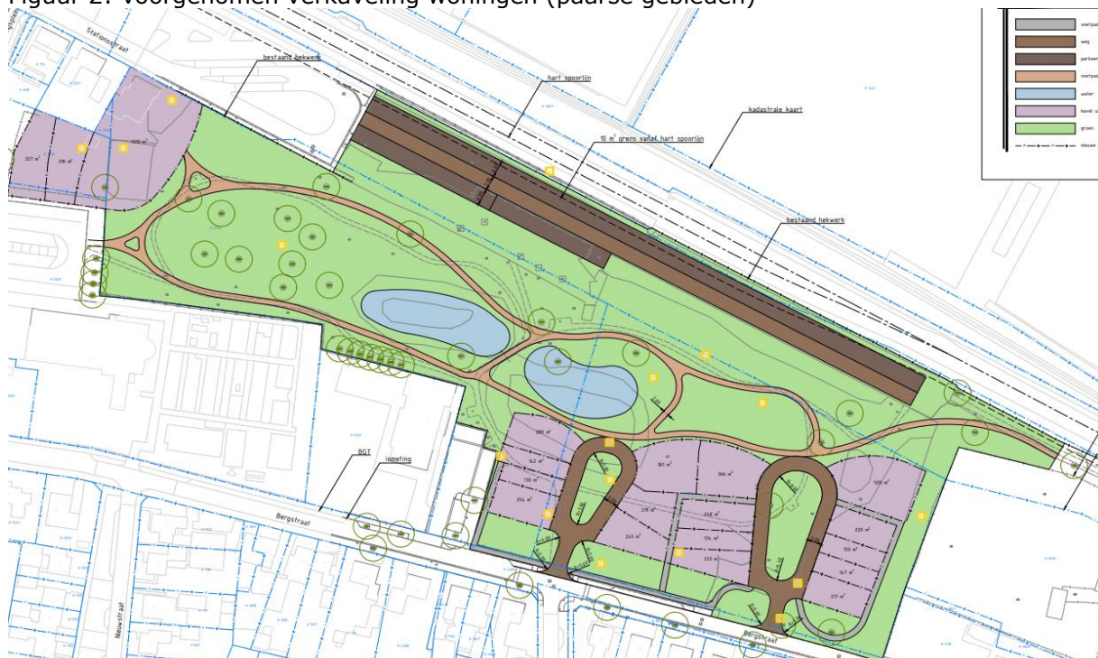
Figuur 2: voorgenumen verkaveling woningen (paarse gebieden)