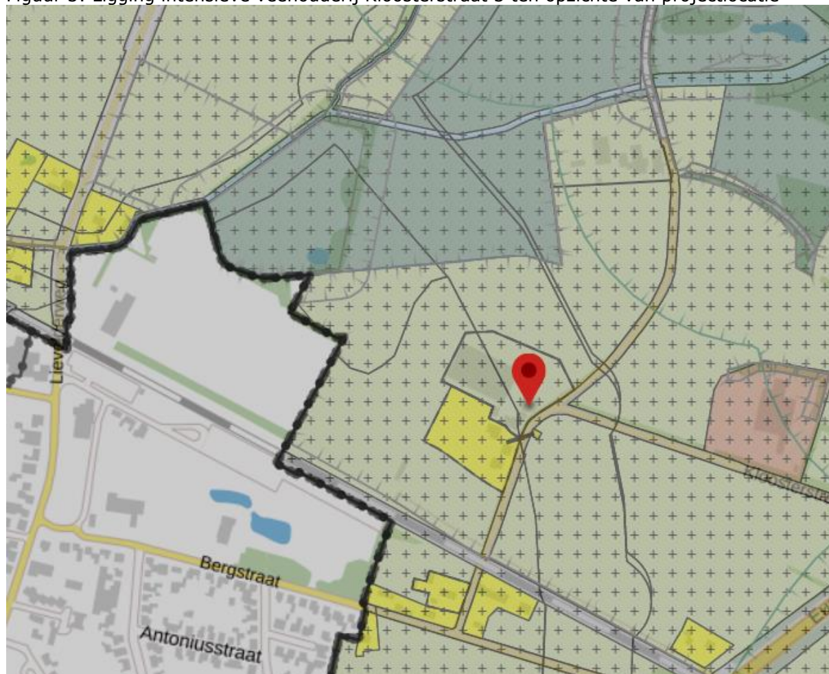
Figuur 3: Ligging intensieve veehouderij Kloosterstraat 3 ten opzichte van projectlocatie

De aangevraagde ontwikkeling vindt plaats binnen de bebouwde kom. Op ongeveer 200 meter van de voorgenomen woningen bevindt zich een intensieve veehouderij op het adres Kloosterstraat 3. Andere veehouderij bedrijven zijn op een afstand van minimaal 400 meter gelegen.