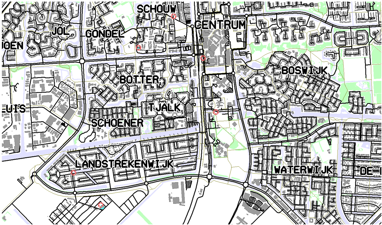
Figuur 3 Sterretjes: vindplaats van scheepswrakken.