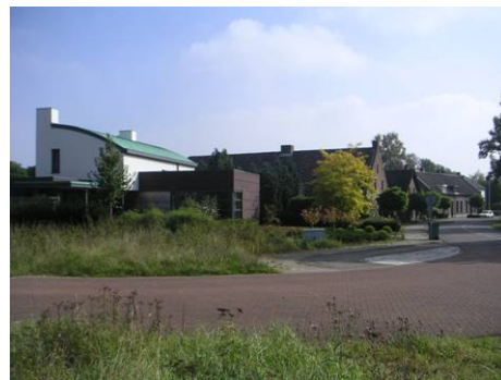
Hoek Hushoverweg – Molenakkerdreef