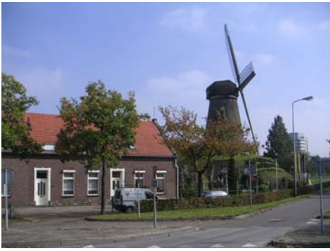
Hushoverweg t.h.v. nr 32 met molen