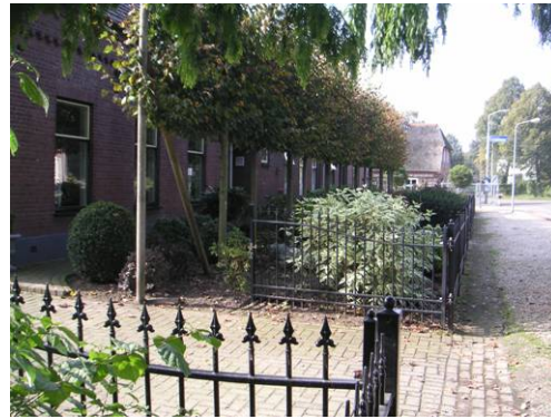
Hushoverweg t.h.v. 77 en 77b