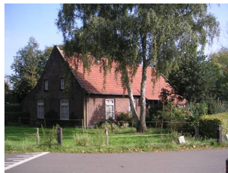
Hoek Hushoverweg 90