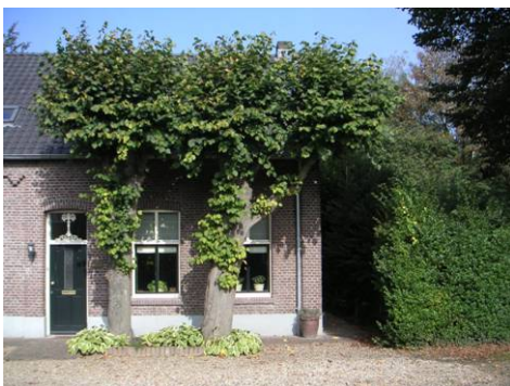
Hushoverweg 88 met leilinden