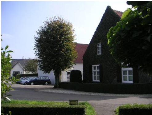
St. Donatuskapelstraat 15