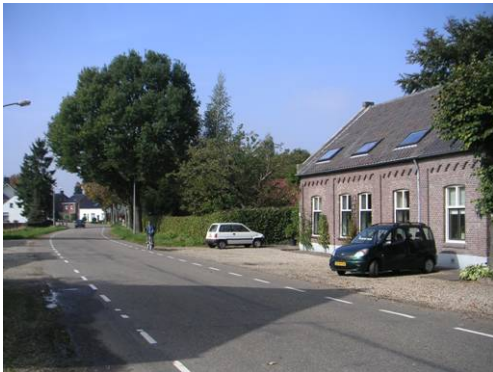
Hushoverweg t.h.v. 88 naar het noorden