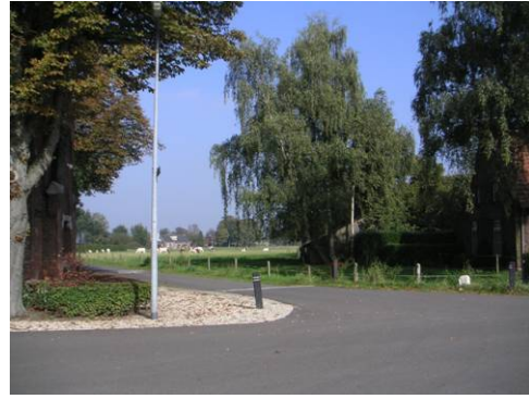
Doorzicht vanaf St. Donatuskapel naar het oosten