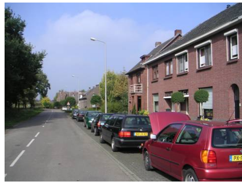
Hushoverweg ten zuiden van de Ringbaan