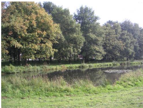
Poel nabij rotonde Ringbaan