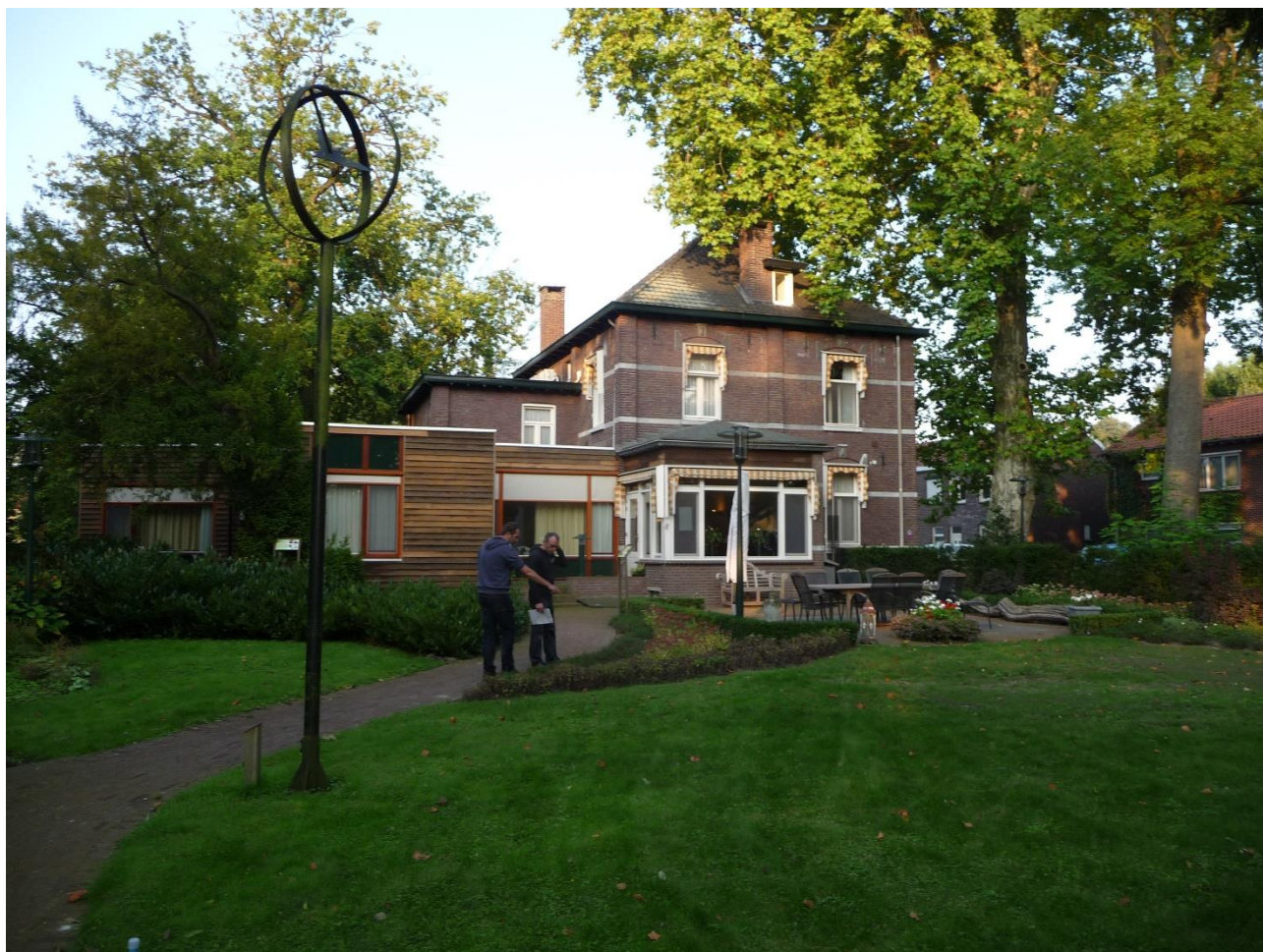
Foto: aanzicht bestaande bebouwing vanuit de tuin

Bestand: 12.07.16 Beeldkwaliteitsplan Datum : 14-10-14 Blad : 4 van 8