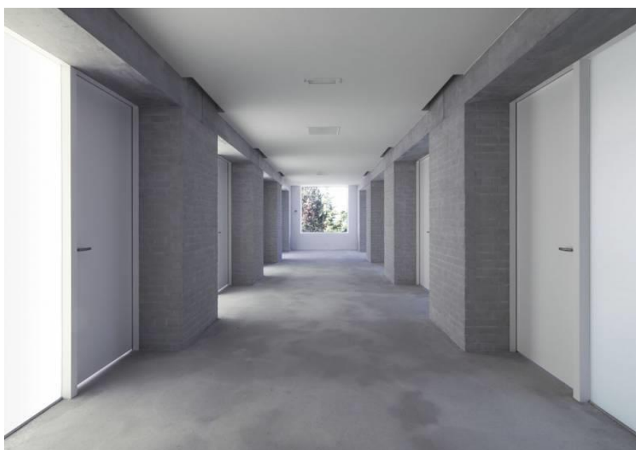
Foto: voorbeeld met slempwerk en prefab beton