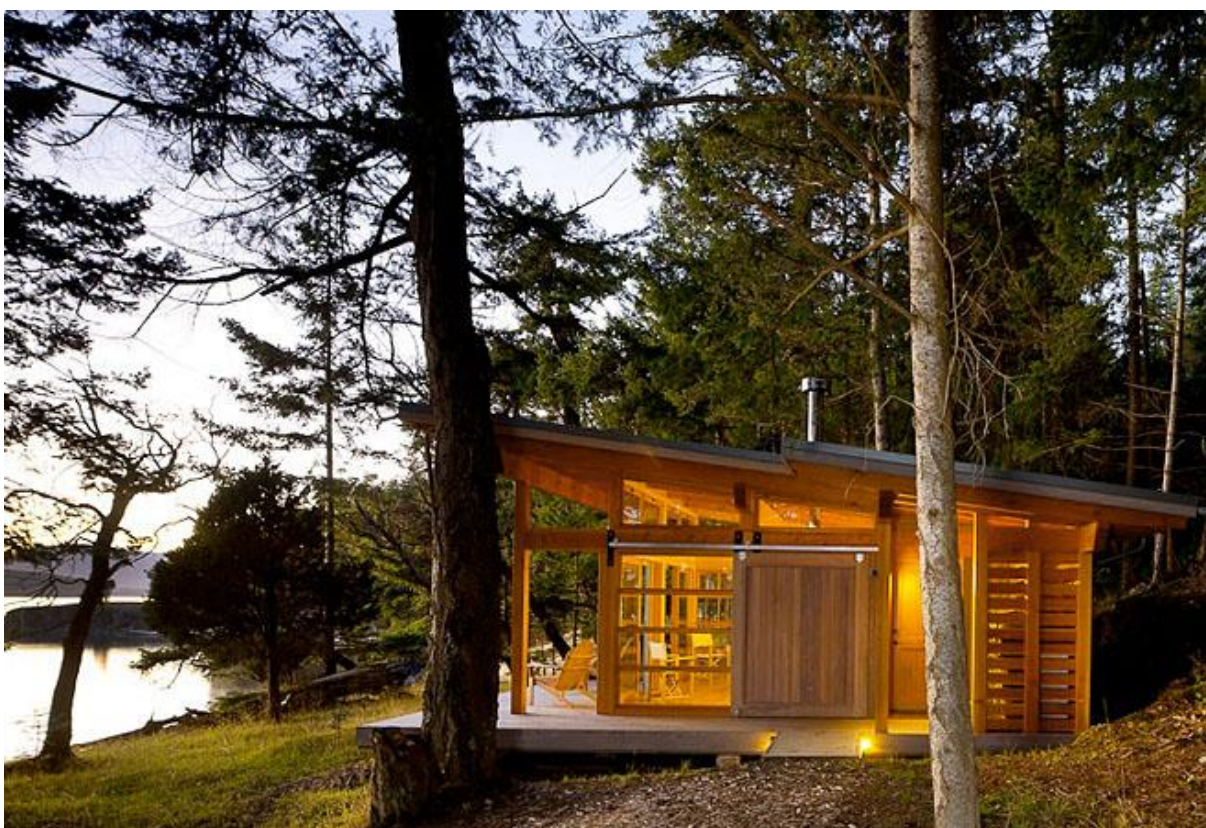
Foto: voorbeeld vorm met lessenaars dak, grote pui en vlonder

Het gebouw zal 3-zijdig vrij gesloten zijn maar met een grote hoge pui aan de zuidzijde aansluitend op een vlonder boven het water. Hierdoor ontstaat er een geborgen ruimte met veel lichtinval en uitzicht op de vijver en tuin.