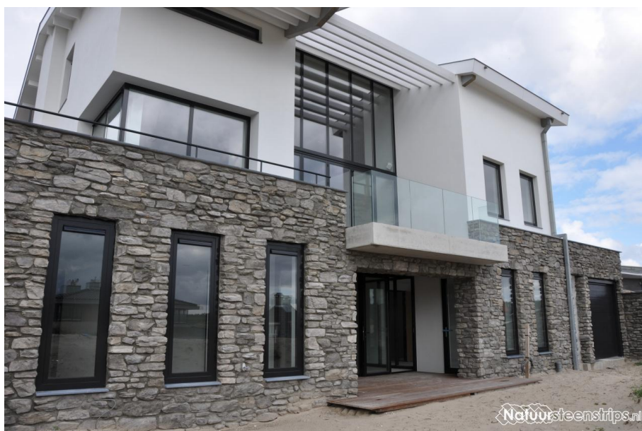
Foto: voorbeeld met natuursteen

Het hoofdgebouw is een statig bakstenen gebouw met duidelijke verspringingen in de gevel en horizontale natuursteen gevelbanden. Het paviljoen krijgt een moderne horizontaal karakter uitgevoerd met passende materialen, bijvoorbeeld, baksteen met slempwerk, natuursteen, zink en dergelijke. Een houten gevel is niet wenselijk vanwege de massa, de ongelijkmatige vergrijzing en het onderhoud. De uitbreiding krijgt een eigen moderne uitstraling passend bij het thema open – gesloten, maar wordt ondergeschikt aan het hoofdgebouw. De uitbreiding krijgt een gedekte kleur passend bij de omgeving en de bestaande bebouwing.