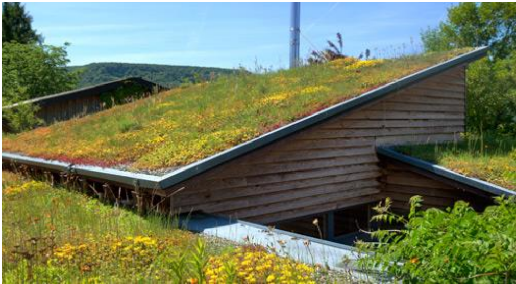
Foto: voorbeeld sedumdak

Bestand: 12.07.16 Beeldkwaliteitsplan Datum : 14-10-14 Blad : 7 van 8