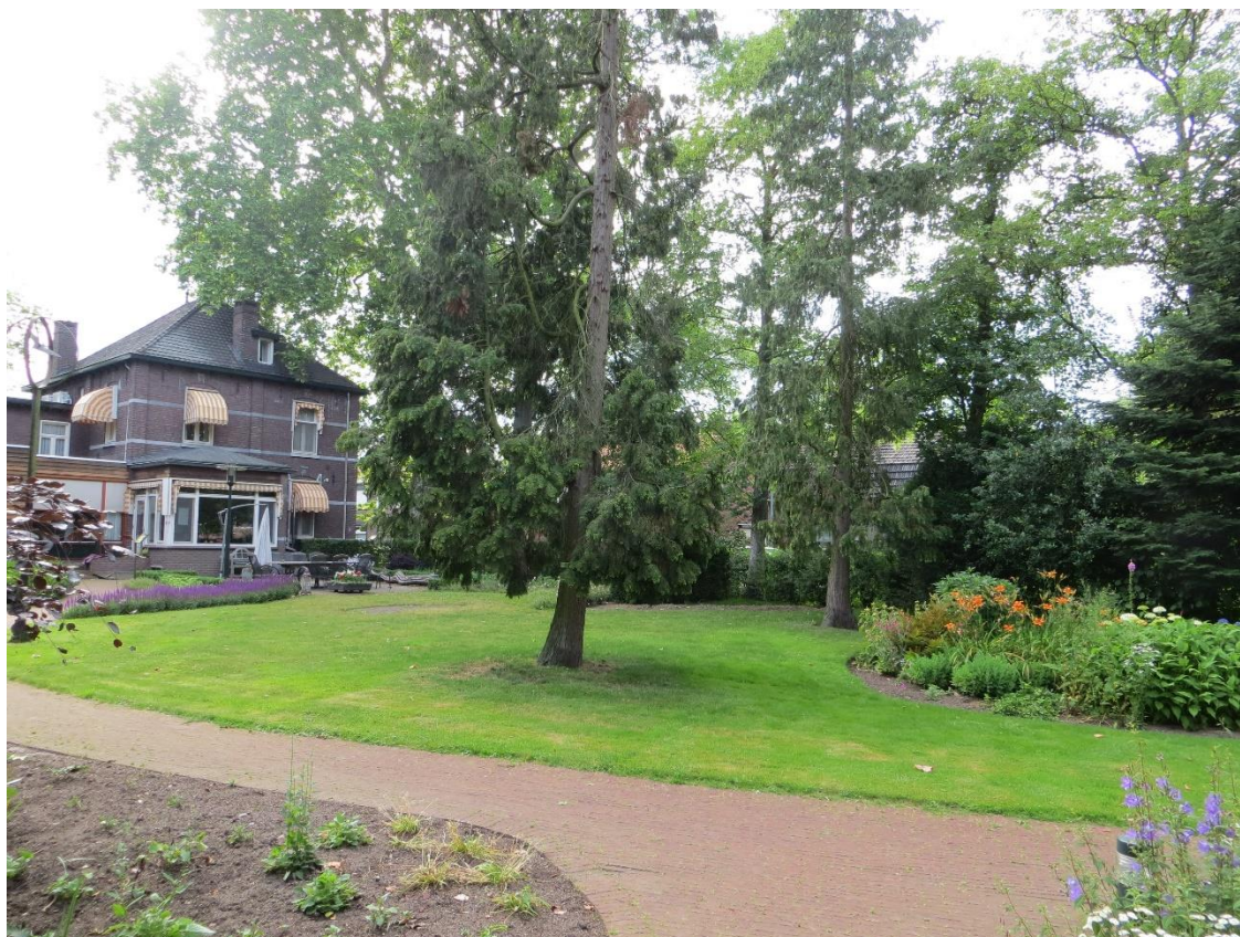
Foto: aanzicht tuin

Bestand: 12.07.16 Beeldkwaliteitsplan Datum : 14-10-14 Blad : 3 van 8