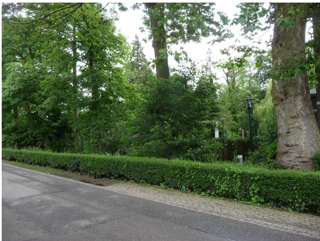
Foto: aanzicht vanuit de Doolhofstraat.