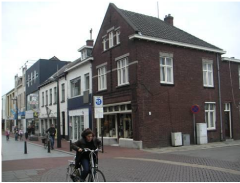
Stationsstraat hoek Boermansstraat