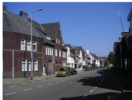
St. Paulusstraat vanaf Waag