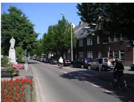
Oostzijde Emmasingel bij St. Paulusstraat