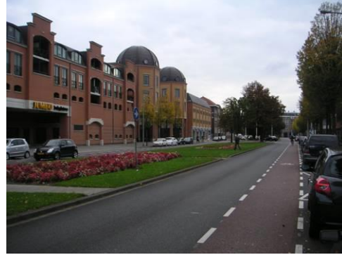
Ursulinencomplex aan de Wilhelminasingel