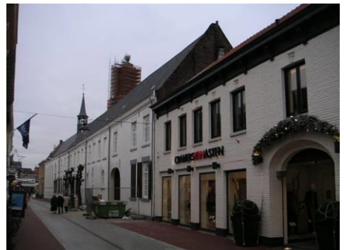
Noordzijde Maastraat ter hoogte van klooster