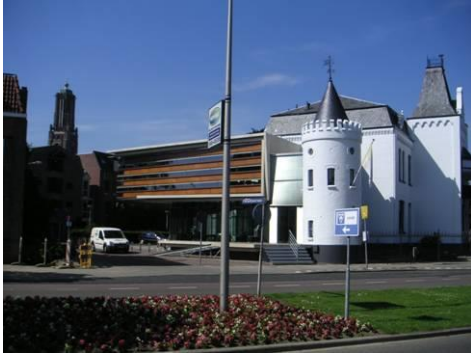
'Kasteel' Walburg met nieuwe vleugel