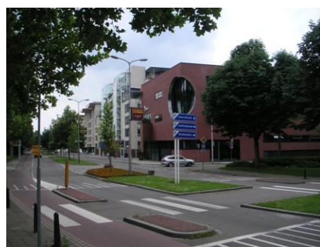
Nieuwbouw aan Kasteelsingel