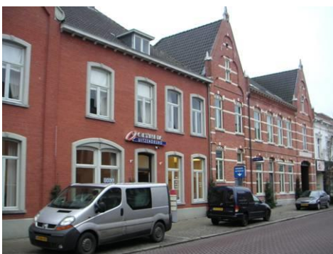
Zuidzijde Maaspoort, hotel Verstraeten