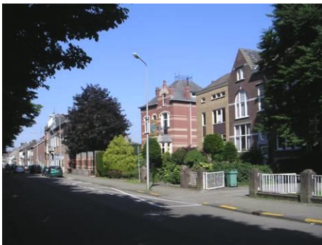
Westzijde Biest tegenover kasteel