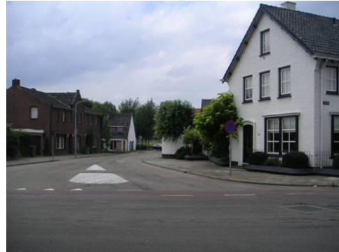
Beekpoort met aanzet richting Hushoverweg