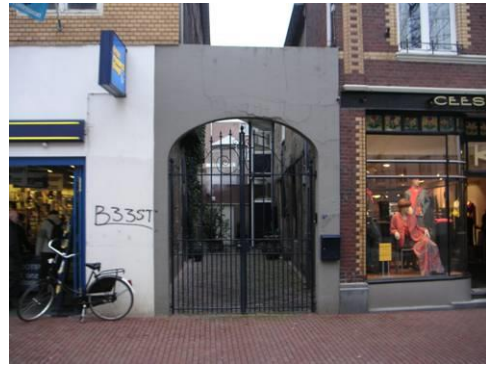
Steeg tussen Langstraat 4 en 6 (vakwerkgevel)