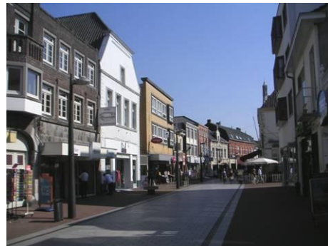
Oostzijde Langstraat tegenover Van Berlostraat