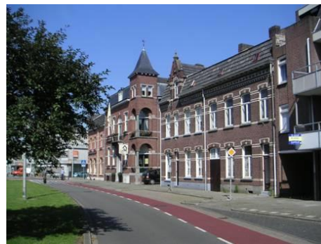
Oostzijde Emmasingel hoek Maaspoort