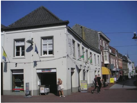
Hoek Markt – Maastraat