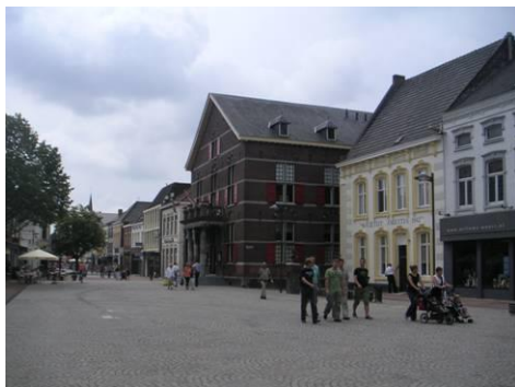
Markt met het Jacob van Hornemuseum