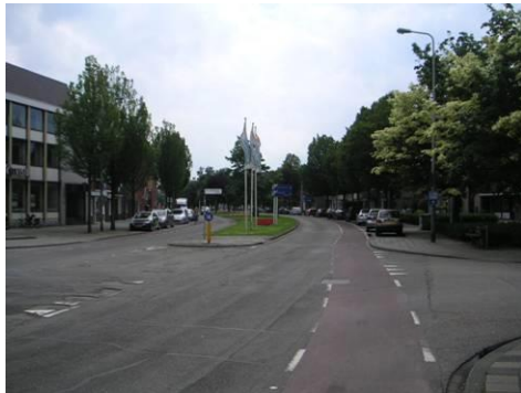
Profiel Wilhelminasingel bij vm. dubbele gracht