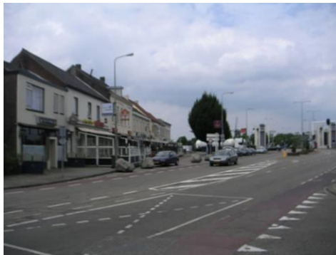
Bassin richting Stadsbrug