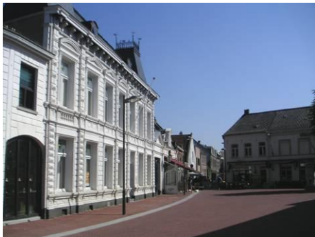
Oostzijde Oelemarkt richting Schoolstraat