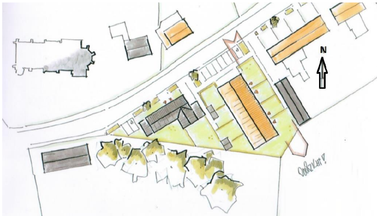
Figuur 3.1. Tekening van de voorgestane situatie. Bron: Novaedes Architecten & Constructeurs.

Alle bebouwing wordt gesloopt en de vegetatie wordt verwijderd. Vervolgens wordt er op nagenoeg dezelfde plaats een twee-onder-een-kapwoning (in de vorm van een langgevelboerderij) gerealiseerd (zie figuur 3.1). Ten noordoosten worden vier aaneengesloten woningen gebouwd, haaks op het Grootdorp. In totaal worden er 12 parkeerplaatsen (twee per woning) aangelegd. Een landschappelijk inpassingsplan voor de inrichting van de tuinen is nog niet voorhanden.