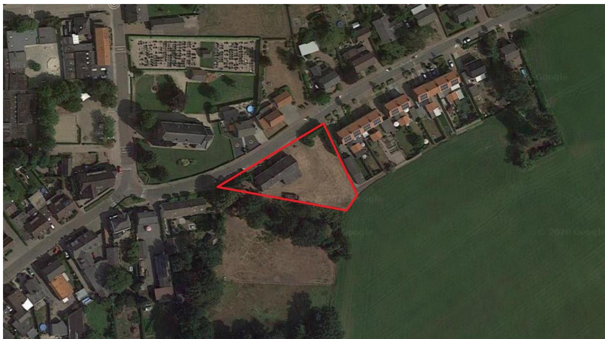
Figuur 4.1. Het plangebied.

Het plangebied zelf omvat een oude woonboerderij met een aanbouw en tuin rondom. In het plangebied komen plantensoorten voor als winterpostelein, biggenkruid, paardenbloem, boerenwormkruid, ridderzuring, paarse dovenetel, kleine brandnetel, kaal knopkruid, vogelmuur, madelief en zachte ooievaarsbek.