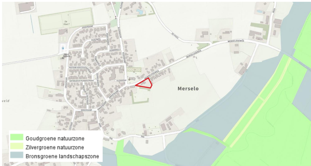
Figuur 4.3. Globale ligging van het plangebied (rood omlijnd) ten opzichte van het NNN (Goudgroene natuurzone).