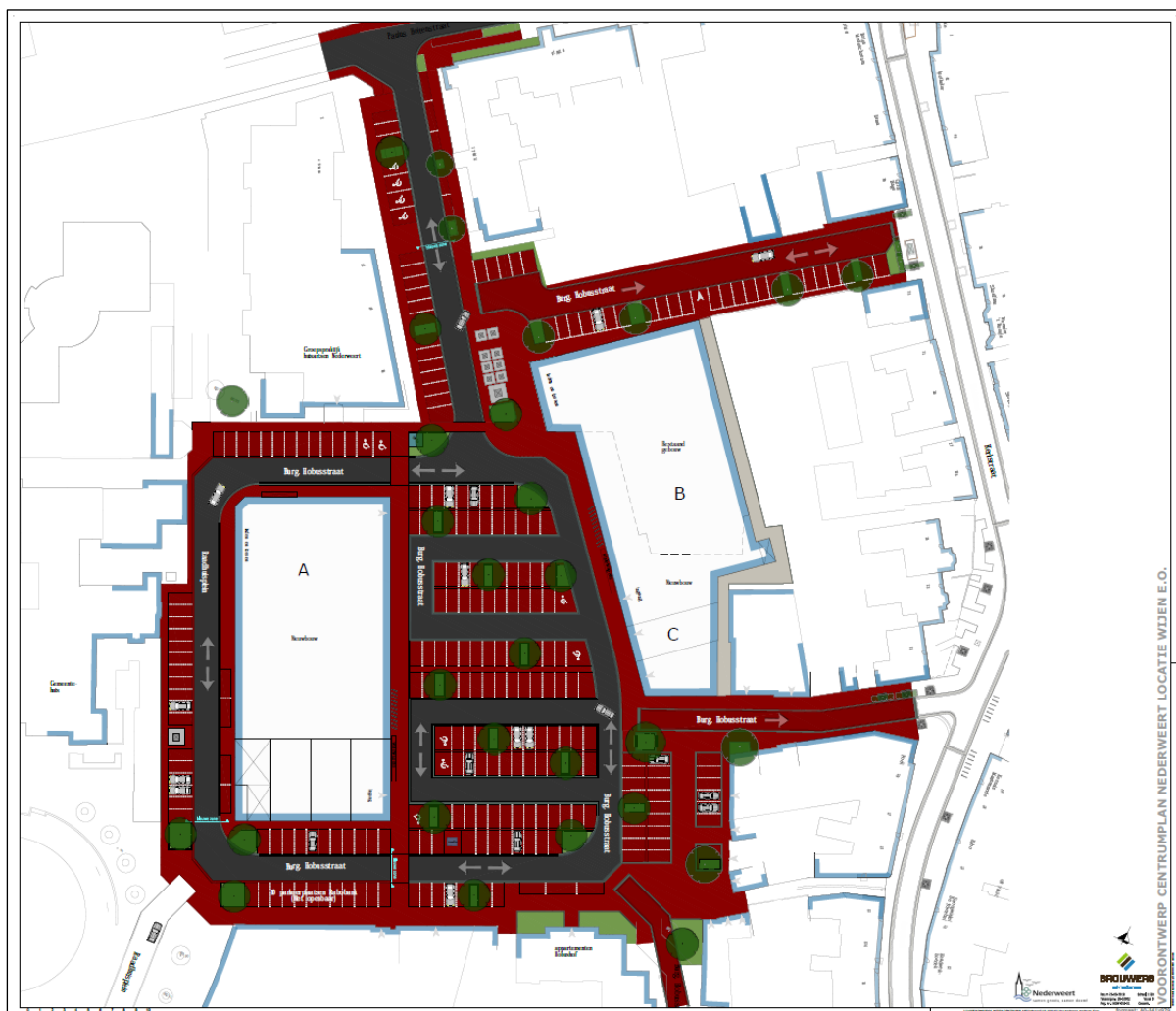
Figuur 3.1 Voorontwerp centrumplan

In figuur 3.1 is het voorontwerp van het plan met de aanduiding voor de verschillende blokken weer-gegeven.