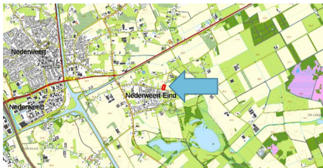
Figuur 1: Topografische kaart ligging plangebied (1:25.000)

De initiatiefnemer is voornemens de huidige bebouwing binnen het plangebied te slopen en een 5-tal levensloopbestendige woningen te realiseren. Tevens zullen er twee Ruimte voor Ruimte-kavels worden gerealiseerd, waarop elk een woning gebouwd mag worden. Figuur 3 geeft een beeld van de toekomstige situatie.