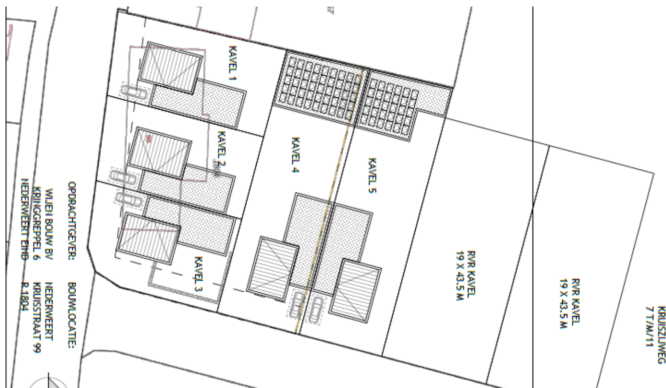
Figuur 3: Toekomstige situatie plangebied