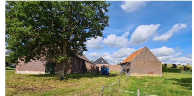
Figuur 5: Plangebied gezien vanuit het oosten, met links de boerderij en rechts de losstaande opstal