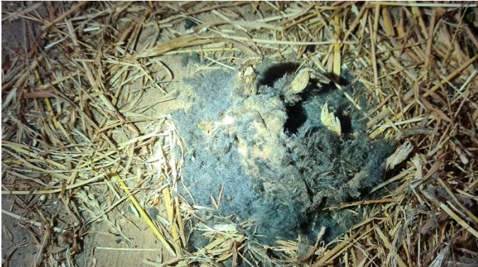
Figuur 14: Mislukt broedsel, vermoedelijk van kerkuil, op de zolder van de opstal aangrenzend aan de woonboerderij

In de opgaande beplanting binnen en rond het plangebied bevinden zich geen jaarrond beschermde nesten van vogels als havik en ransuil. Wel kunnen mogelijk "algemene" soorten als merel, roodborst, heggemus, zwartkop, winterkoning en houtduif tot broeden komen in de opgaande beplanting binnen en rond het plangebied, met name in de bomenrij grenzend aan de Kruiszijweg. In het geval van kappen zal dit buiten het broedseizoen moeten plaatsvinden, om verstoring van een eventueel nest te voorkomen. Deze bomenrij blijft echter behouden.