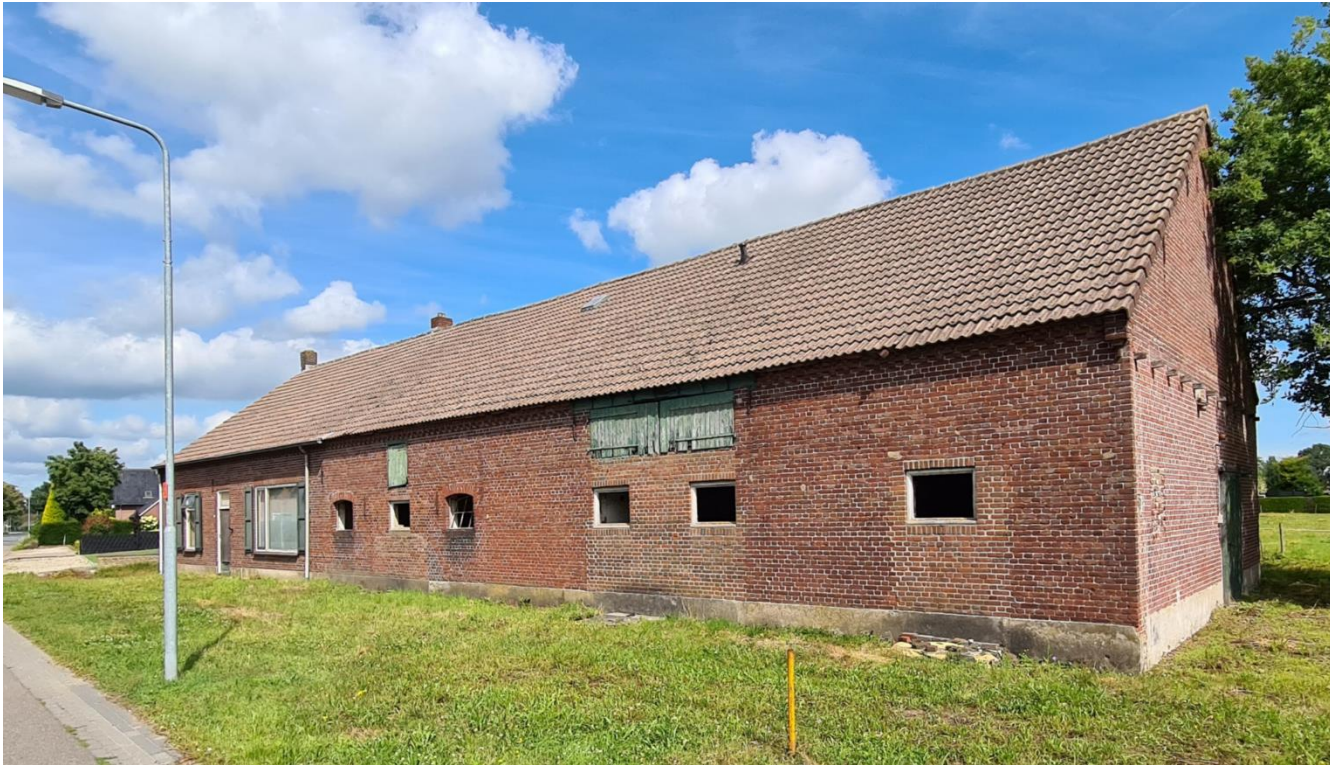
Figuur 4: Plangebied gezien vanuit het zuiden, met zicht op de woonboerderij met aansluitende opstal