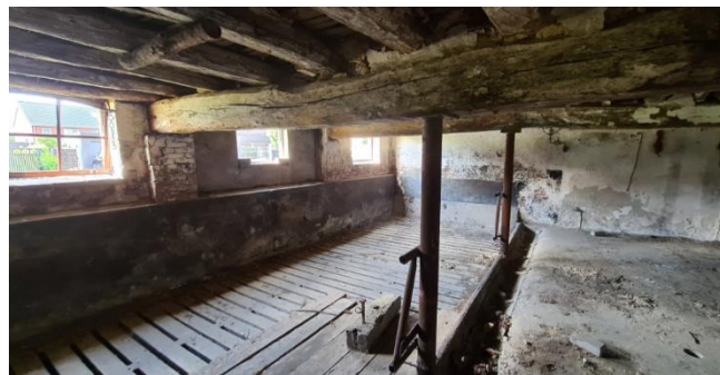
Figuur 8: Binnen-aanzicht van de aansluitende opstal van de woonboerderij