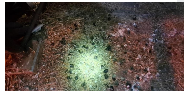
Figuur 12: Braakballen en krijtsporen op de zolder van de woonboerderij

In de zolderruimten van zowel de woonboerderij, aangrenzende opstal als de losstaande opstal zijn sporen van de kerkuil gevonden. Een grote hoeveelheid braakballen, krijtsporen en veren zijn aangetroffen, wat duidt op de aanwezigheid van een verblijfplaats van deze soort (Figuur 12 en 13). Tevens is er een waarschijnlijk mislukt broedsel van de soort aangetroffen (Figuur 14).