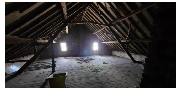
Figuur 9: Zolderruimte van de woonboerderij