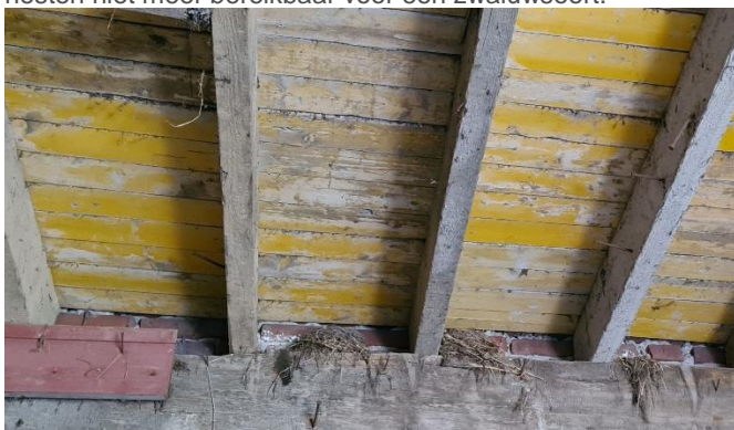
Figuur 11: Verlaten zwaluwnesten in opstal

De losstaande opstal heeft een zadeldak belegd met kleigebakken dakpannen. De pannen liggen recht en sluiten goed op elkaar aan. Er is geen dakbeschot aanwezig, waardoor de nauwe ruimten waar huismus en gierzwaluw een voorkeur voor hebben afwezig zijn. De aanwezigheid van een nestplaats van huismus of gierzwaluw onder het dak worden uitgesloten. Oude zwaluwnesten zijn aangetroffen onder het plafond van de begaand grond (Figuur 11). Daar de deur van de opstal, welke als toegang diende, gesloten is, zijn deze nesten niet meer bereikbaar voor een zwaluwsoort.