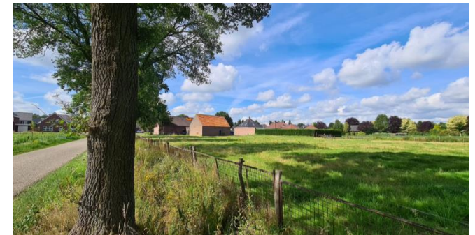
Figuur 6: Plangebied gezien vanuit het noordoosten, vanaf de Kruiszijweg