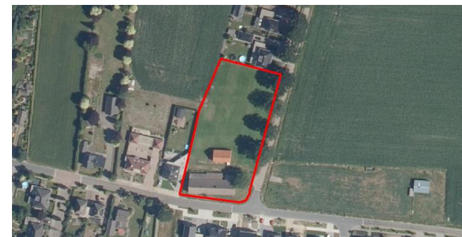
Figuur 2: Luchtfoto plangebied en directe omgeving