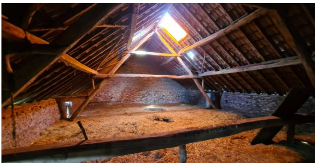
Figuur 7: Zolderruimte van de aansluitende opstal van de woonboerderij