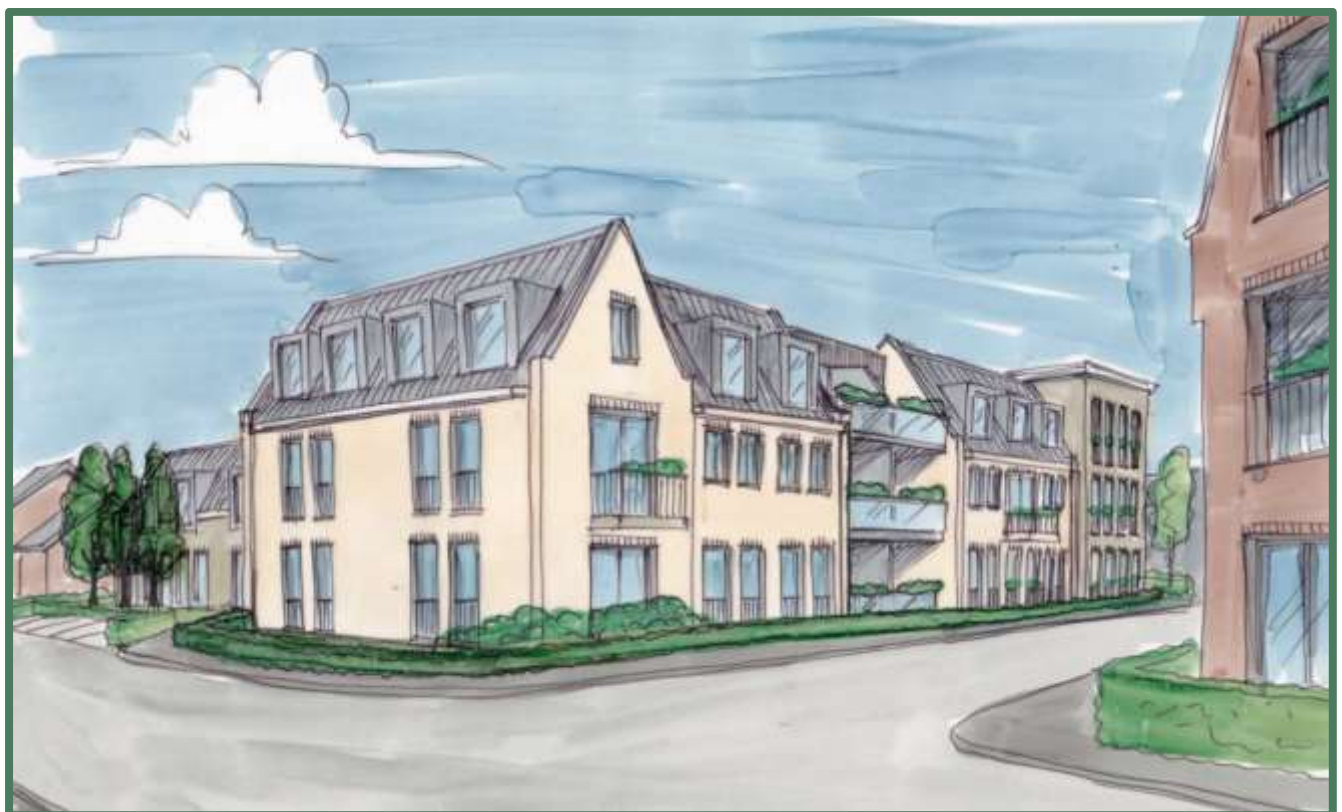
Impressie Architectuur hoek Wildertsedijk/Industrieweg.