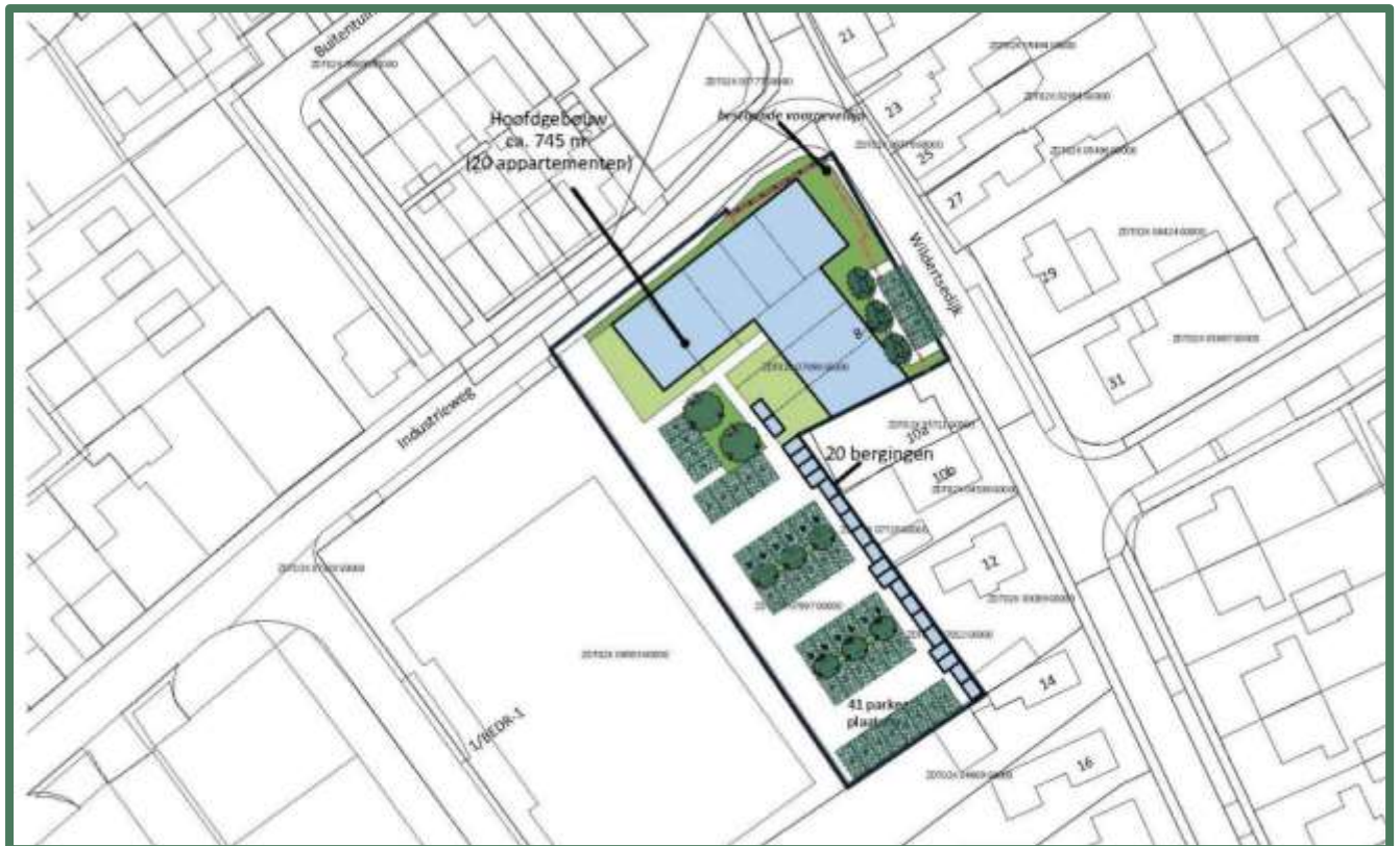
Beoogde situatie.