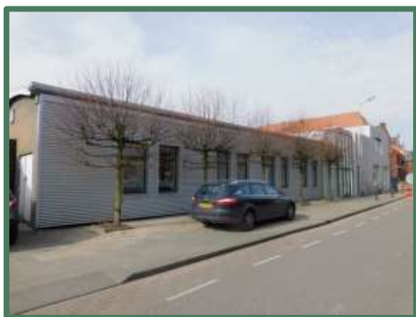
Voorzijde (oost) hoofdgebouw

Aan de voorzijde van het gebouw staan vijf lindebomen. Het plangebied is naast de bebouwing grotendeels betegeld.