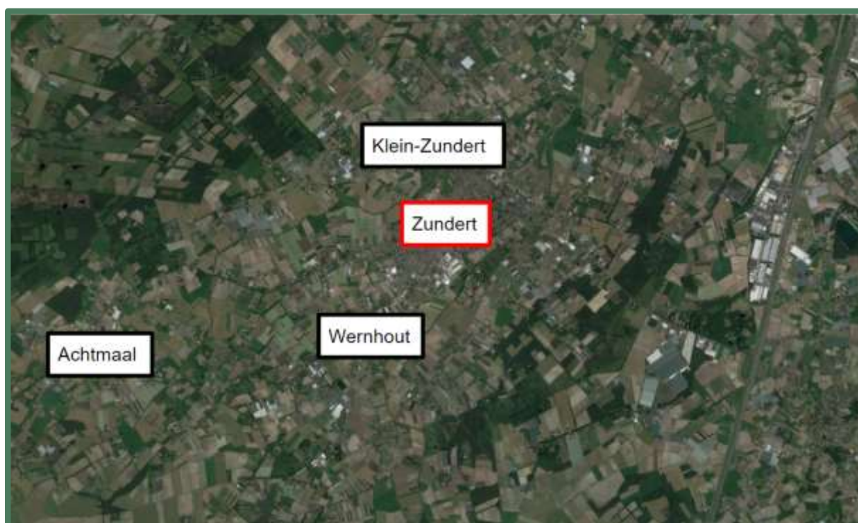
Satellietfoto omgeving plangebied, planlocatie bevindt zich in Zundert (rood omrand).

De ligging van het plangebied in de ruimere omgeving is weergegeven in onderstaande afbeelding.