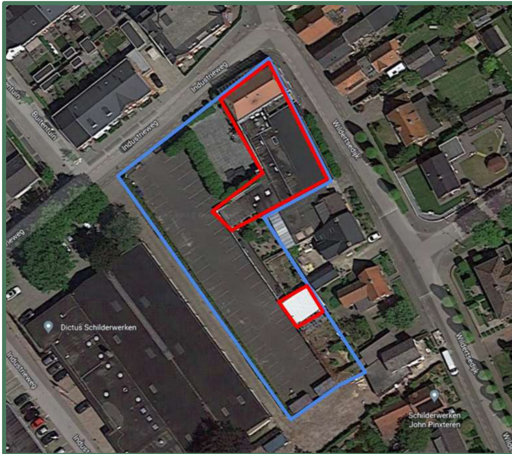
Globaal omliggende planlocatie in blauw en de te slopen bebouwing in rood.