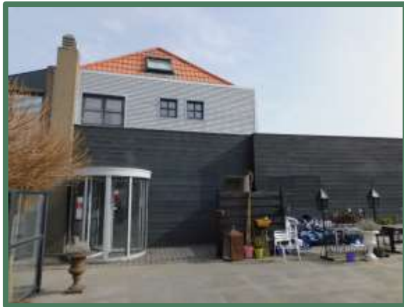
Achterzijde (west) hoofdgebouw