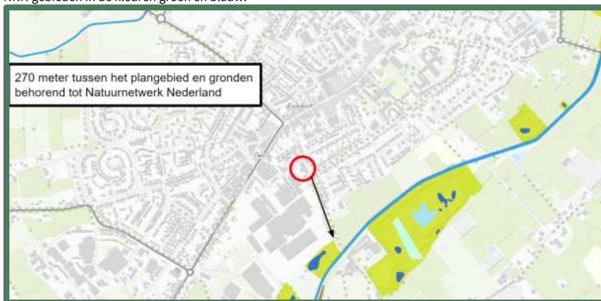
Natuur Netwerk Nederland gebieden. De afstand tussen het plangebied en NNN is met een pijl aangegeven.

Het plangebied ligt op minimaal 270 meter afstand van gronden die tot het Natuurnetwerk Nederland behoren. Op onderstaande afbeelding wordt de ligging van het Natuurnetwerk Nederland in de omgeving van het plangebied weergegeven. De ligging van het plangebied wordt met een rode cirkel aangegeven. De NNN gebieden in de kleuren groen en blauw.