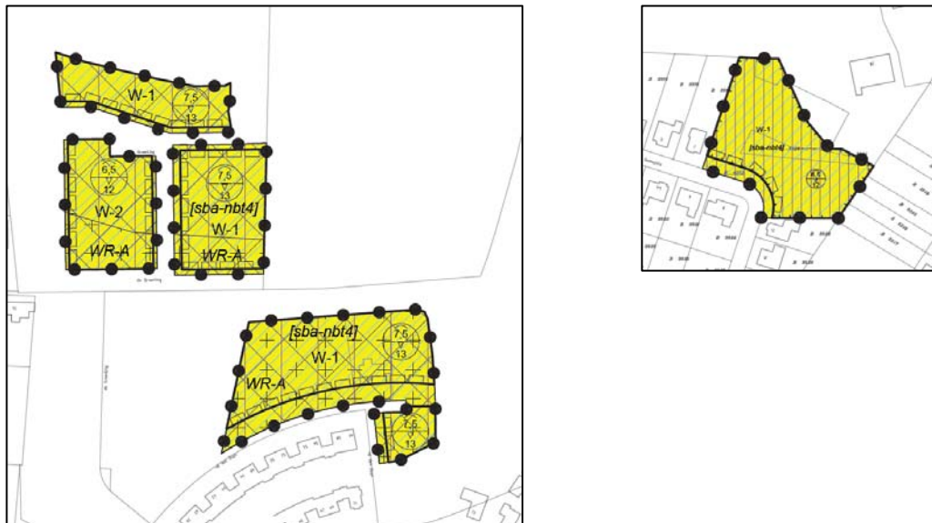
Uitsnede verbeelding bestemmingsplan "Bouwhoogten De Hoef". Op de verbeelding zijn de gewenste goot- en bouwhoogten opgenomen, naast de al geldende aanduidingen.

Onderhavige partiële herziening betreft enkel een wijziging van de goot- en bouwhoogte. Ten tijde van de totstandkoming van het bestemmingsplan voor de ontwikkeling van woonwijk De Hoef heeft een volledige planologische verantwoording van de beoogde ontwikkeling van woonwijk De Hoef plaatsgevonden. Een dergelijke verantwoording wordt met dit bestemmingsplan niet noodzakelijk geacht.