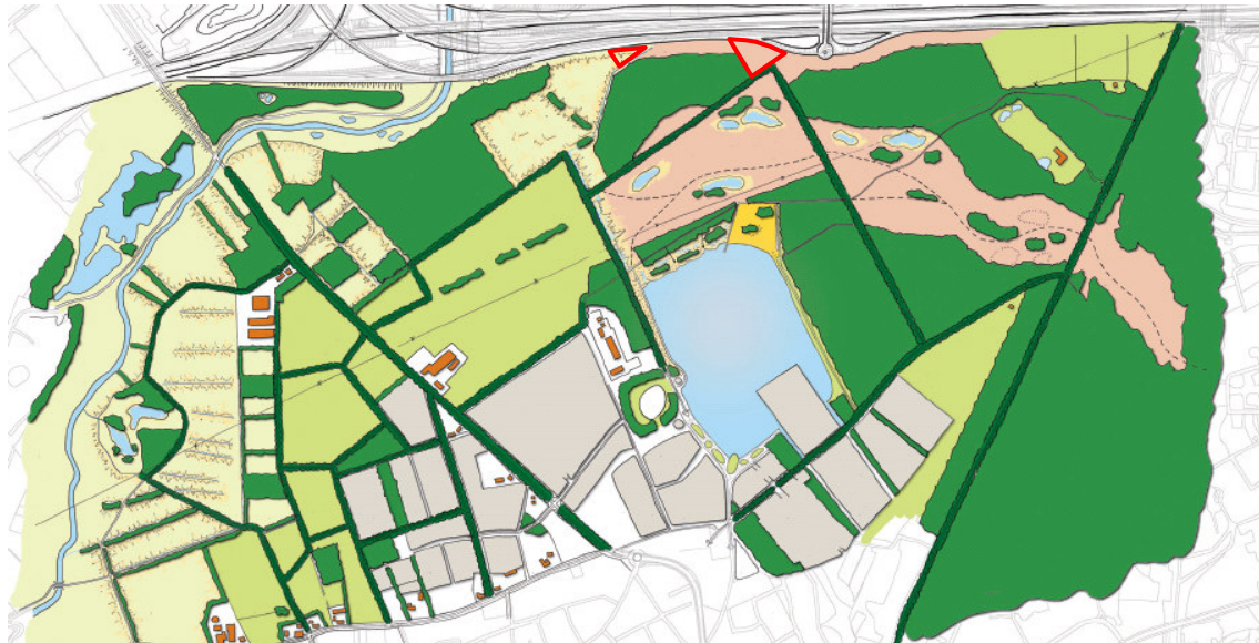
Figuur 3 Ontwerp landschapsplan de Groene Mantel en twee compensatielocaties Waalre Noord (rode belijning)