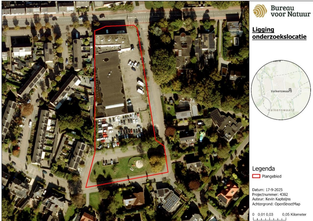
Figuur 2 Ligging onderzoekslocatie met satellietbeeld