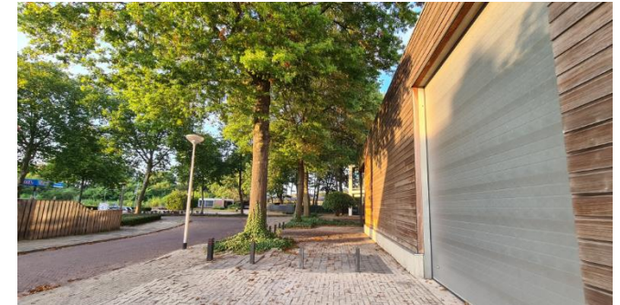
Figuur 5: Plangebied gezien vanaf de Bonifaciusstraat