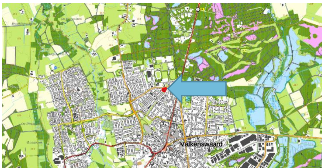
Figuur 1: Topografische kaart ligging plangebied (1:25.000)

De initiatiefnemer is voornemens de huidige bebouwing binnen het plangebied te slopen. Hierna zal een appartementencomplex, bestaande uit 22 appartementen, en 12 woonhuizen binnen het plangebied gerealiseerd worden. Tevens zal er een binnenplein met parkeergelegenheden worden aangelegd. Figuur 3 geeft een beeld van de toekomstige situatie.