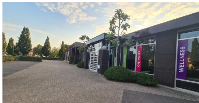
Figuur 8: Plangebied gezien vanuit het oosten