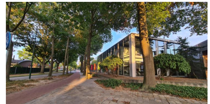
Figuur 9: Plangebied gezien vanuit het westen, vanaf de Geenhovensedreef