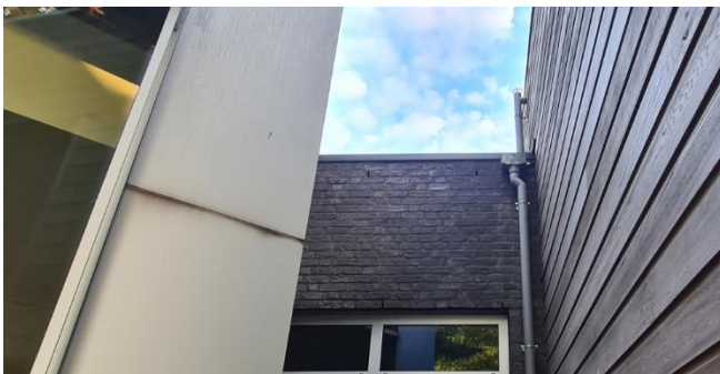
Figuur 7: Open stootvoegen in de westgevel