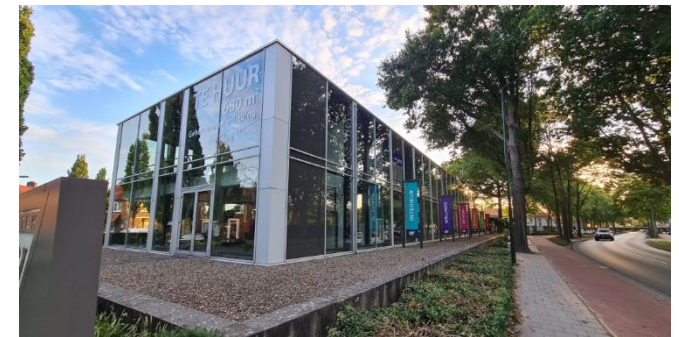
Figuur 6: Plangebied gezien vanuit het noorden, vanaf de Geenhovensedreef