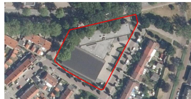
Figuur 2: Luchtfoto plangebied en directe omgeving