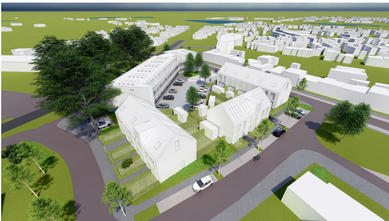
Figuur 3: Toekomstige situatie plangebied