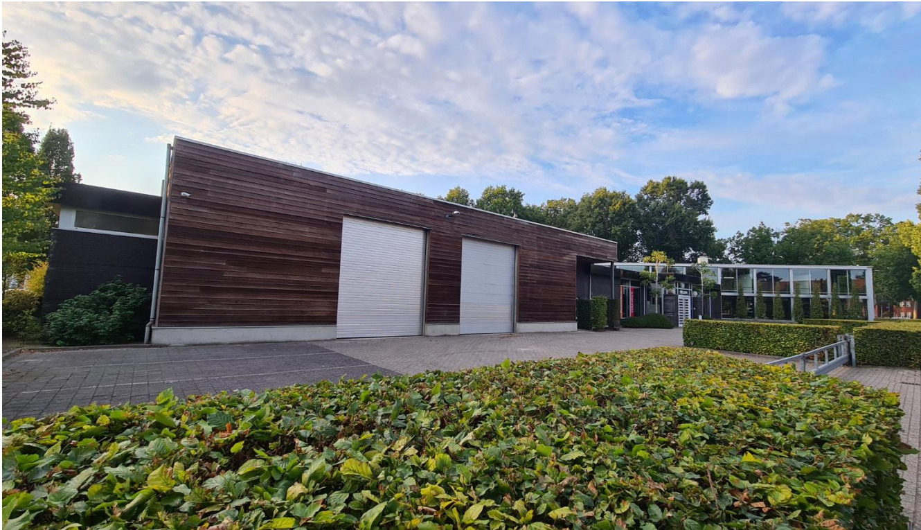
Figuur 4: Plangebied gezien vanuit het zuidoosten, vanaf de Willibrorduslaan