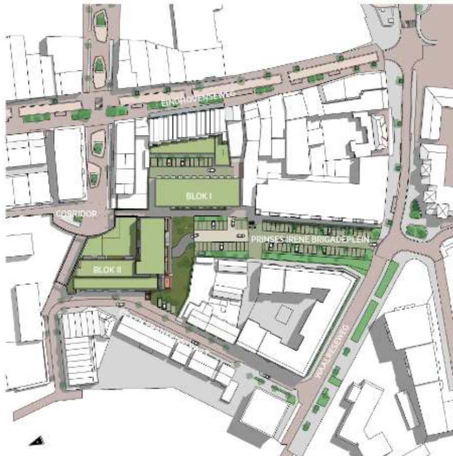
Figuur 5.1: voorgenomen plan

In figuur 5.1 is een uitsnede opgenomen van het stedenbouwkundig plan.