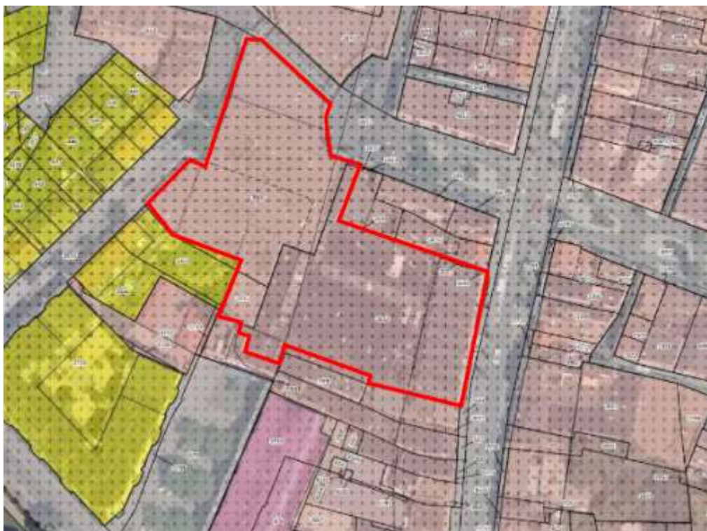
Figuur 2.2: Ligging plangebied (rood omcirkeld).

Op basis van de dubbelbestemmingen 'Waarde – Archeologie' geldt een archeologische onderzoeksplicht bij bodemingrepen die dieper gaan dan 30 cm onder maaiveld en groter zijn dan 100 en/of 500 m 2 . In paragraaf 4.3.1 wordt nader ingegaan op het aspect archeologie.