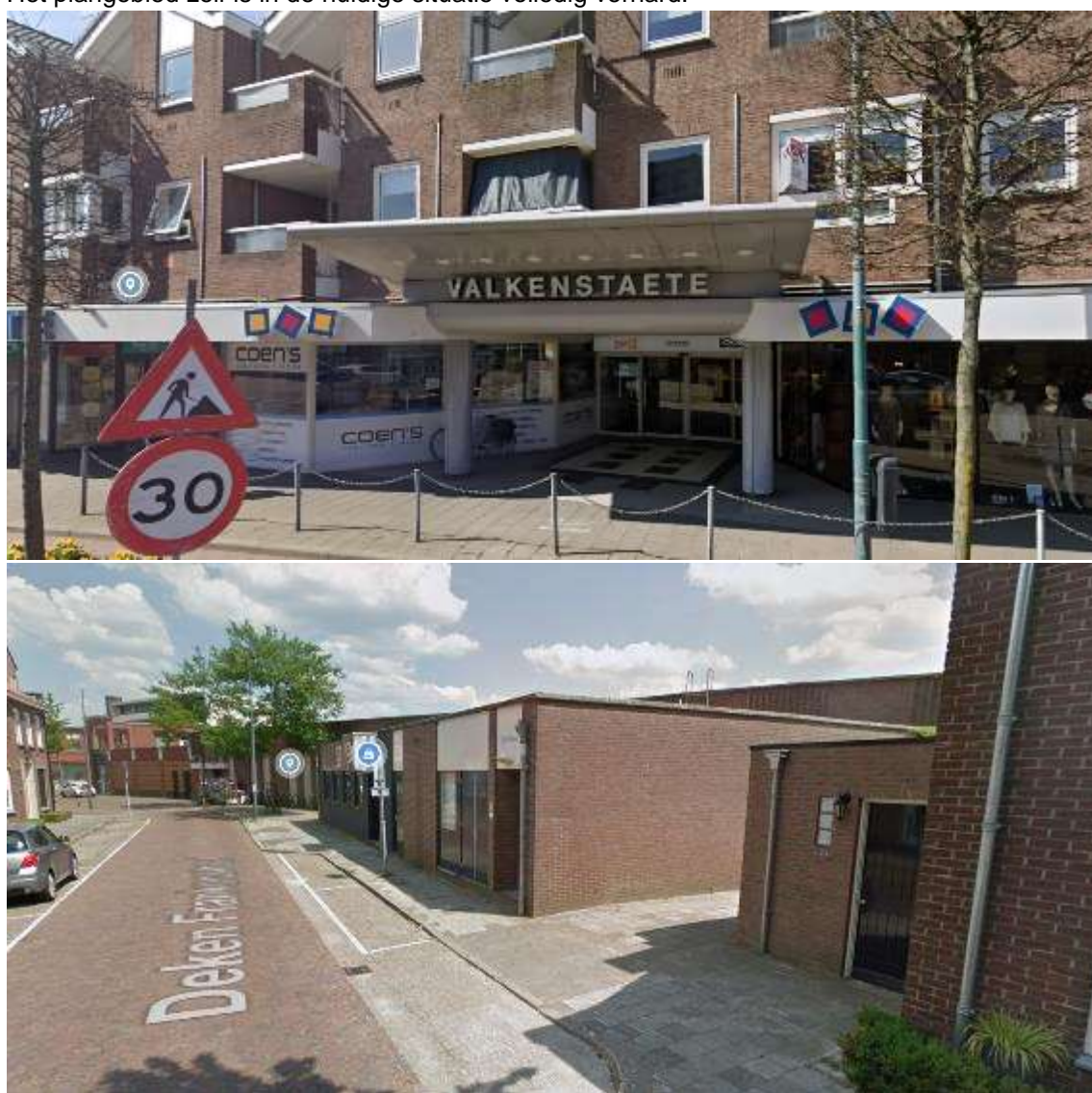
Figuur 4.1: Weergave huidige situatie. Figuur boven geeft weergave vanuit de Eindhovenseweg. Figuur beneden geeft weergave vanuit de Deken Frankenstraat.

Het plangebied is gelegen aan de Eindhovenseweg, in het centrum van Valkenswaard. Het plangebied wordt aan de oostzijde begrensd door de Eindhovenseweg en is aan de westzijde door de Deken Frankenstraat. Het plangebied is grotendeels gelegen binnen een centrumgebied met een combinatie van woningen. In de huidige situatie is er een overdekt winkelcentrum aanwezig, welke grotendeels gedateerd is. De bebouwing bestaat voornamelijk uit één bouwlaag met plat dak en de bebouwing richting de woonwijk uit 1 bouwlaag met plat dak, maar aan de Eindhovenseweg zijn ook woningen op de verdiepingen gesitueerd. Aan de zijde van de Deken Frankenstraat zijn de 'achterkanten' van het overdekt winkelcentrum gesitueerd, waardoor het straatbeeld aan deze zijde van mindere kwaliteit is. Het plangebied zelf is in de huidige situatie volledig verhard.