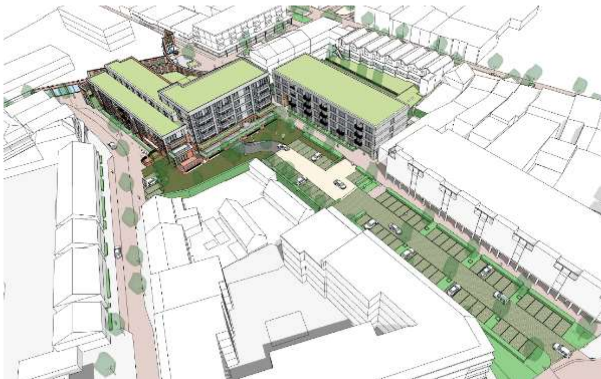
Figuur 5.2: voorgenomen plan

Om te bepalen of er sprake is van een toename van verkeer dient de verkeersgeneratie van de bestaande functies in het plangebied te worden vergeleken met de verkeersgeneratie van de nieuwe woningen. Op basis van het vigerende bestemmingsplan zijn reeds functies toegestaan zoals detailhandel en horeca met een hogere verkeersaantrekkende werking. Voor de huidige situatie is daarom gekozen voor de functie 'full service supermarkt', waarvoor per 100 m 2 bvo een verkeersgeneratie wordt verwacht van 84,4 motorvoertuigen per etmaal. In de huidige situatie heeft het bouwvlak een oppervlakte van circa 5.500 m 2 . Op basis van deze uitgangspunten is de huidige verkeersgeneratie vele malen hoger dan met onderhavige ontwikkeling mogelijk wordt gemaakt. Er worden dan ook geen belemmeringen verwacht met de verkeersafwikkeling op de wegen rond het plangebied.