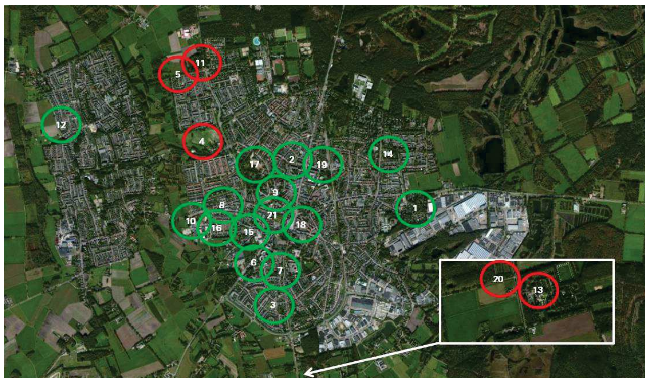
Figuur 2: Overzicht ligging zachte plannen gemeente Valkenswaard

*Bij de definitie binnen bestaand stedelijk gebied zijn we uitgegaan van hetgeen daarover opgenomen in de wettekst en de verdere invulling van die definitie aan de hand van jurisprudentie zoals de zaak Veghel.