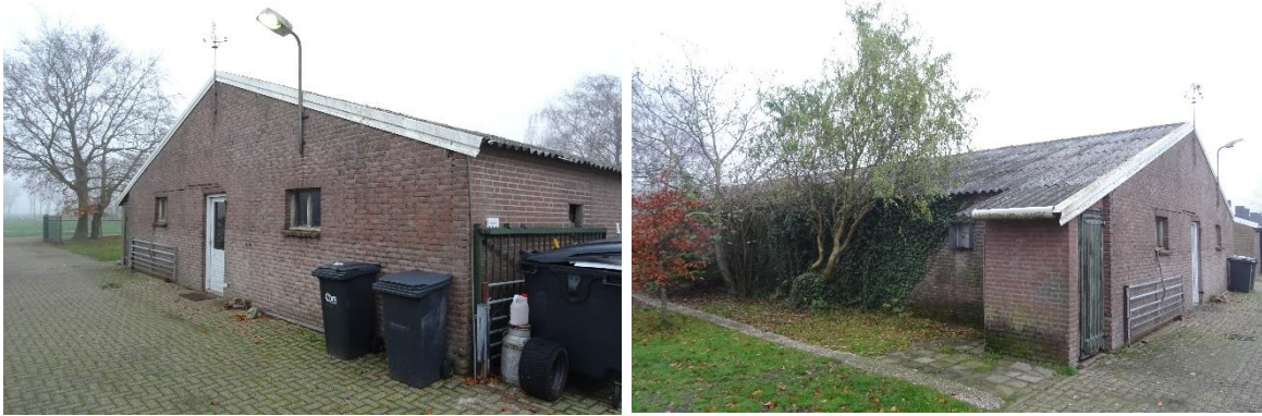
Afbeelding 3 en 4: Bestaande te slopen varkensstallen op de kavel.