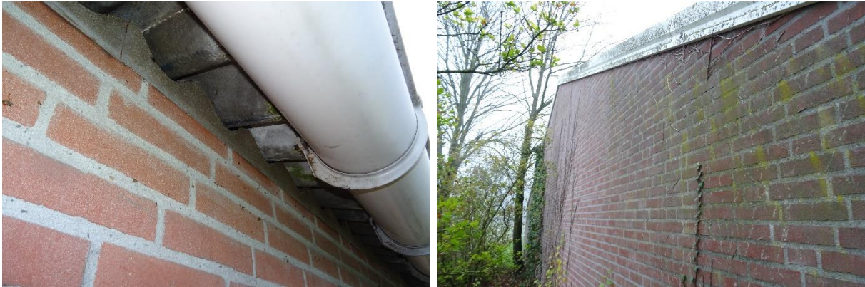
Afbeelding 12 en 13: Gesloten daken/ geen toegang tot aanwezige spouwmuur, d.m.v. vogelschroot en dakbeschoot/ daktrim sluit nagenoeg naadloos aan op de bebouwing. Datum: 02-12-2020

Door de aanwezigheid van vogelschroot (zie afbeelding 12) en de afwezigheid van open stootvoegen, is de spouwmuur niet toegankelijk. Ook zijn spouwmuren in varkensstallen in het algemeen niet geschikt door de aanwezigheid van tocht, waar vleermuizen een hekel aan hebben. Nader onderzoek naar vleermuizen in de varkensstal wordt dan ook niet nodig geacht.