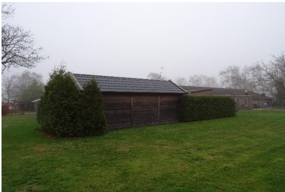
Afbeelding 5: Bestaand tuinhuis op de kavel. Deze zal voor de bouw van de nieuwe woningen verwijderd worden.

Ook het bestaand tuinhuis gaat gesloopt worden om de bouw van de nieuwe woningen mogelijk te maken (zie afbeelding 5). In dit soort tuinhuisen zijn vaak in trek bij huismussen en vleermuizen. Beoordeeld moet worden of (beschermde) soorten het tuinhuis gebruiken.