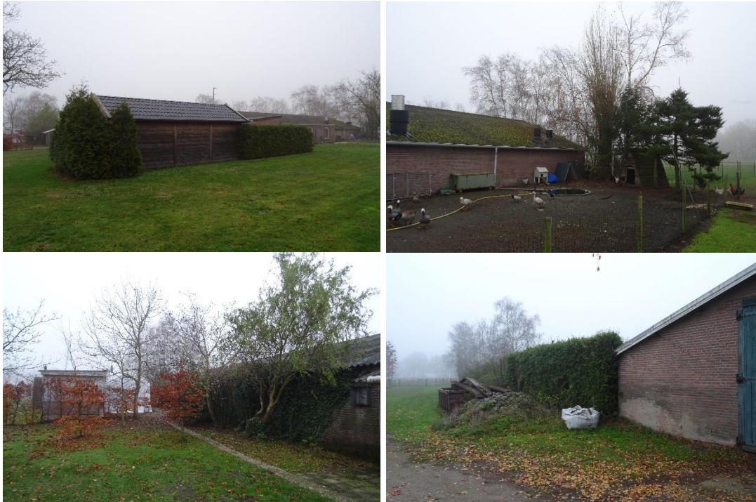
Afbeelding 6, 7, 8 en 9: Bestaande beplantingen op de kavel nabij de te slopen/ verwijderen bebouwingen (stallen, tuinhuis, woonunit).