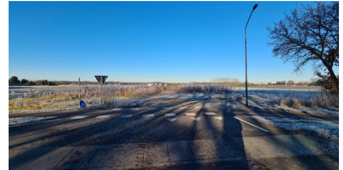
Figuur 5: Plangebied gezien vanaf de Mgr. Smetsstraat