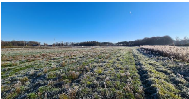
Figuur 7: Midden van het plangebied