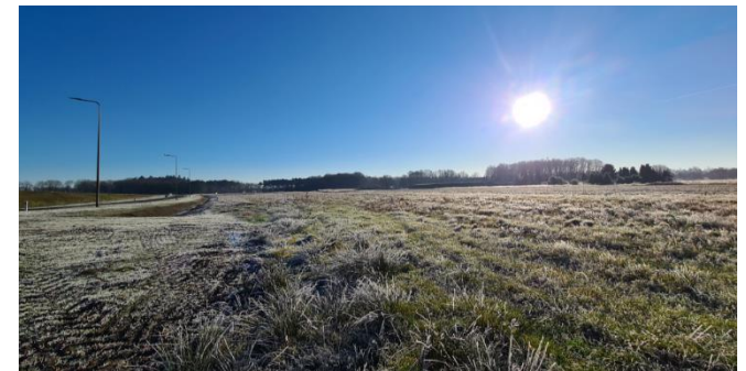
Figuur 6: Plangebied gezien vanaf de zuidelijke toe-/afrit van de N69