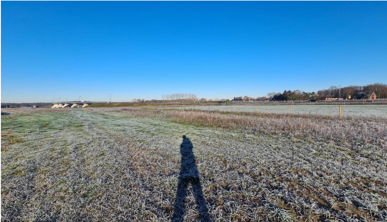
Figuur 4: Plangebied gezien vanuit het oosten