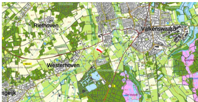
Figuur 1: Topografische kaart ligging plangebied (1:25.000)

De initiatiefnemer is voornemens een verbinding tussen de zuidelijke toe-/afrit van de N69 en de Mgr. Smetsstraat te realiseren. Het betreft een 60 km/h-weg van circa 150 meter lengte, met een ontsluitende functie voor aanwonenden en agrariërs. Figuur 3 geeft een beeld van de toekomstige situatie.