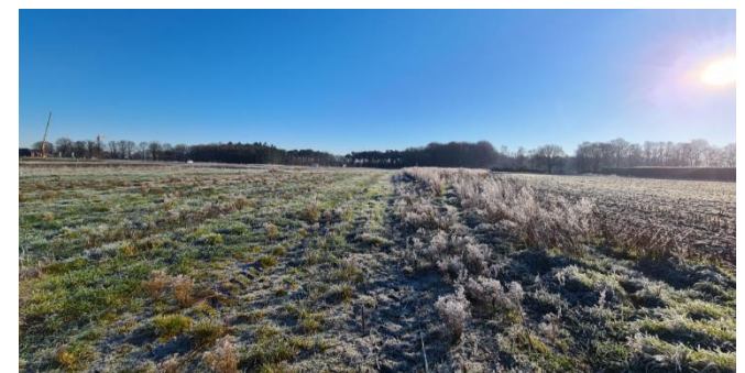
Figuur 9: Zuidrand van het plangebied