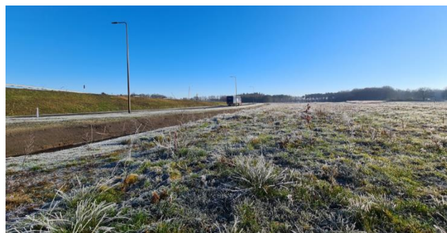
Figuur 8: Recentelijk aangeplante begroeiing ten noorden van het plangebied