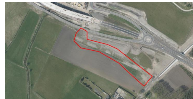
Figuur 2: Luchtfoto plangebied en directe omgeving