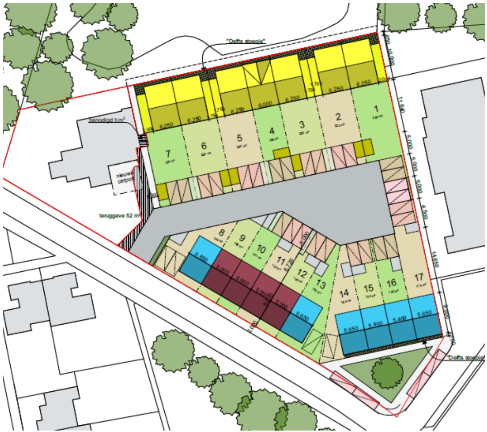
plansituatie (Bron: Keeris Architecten)