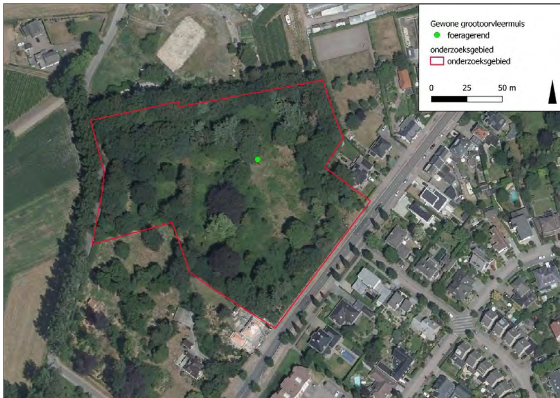
Figuur 7: Waarnemingen van Gewone grootoorvleermuis.