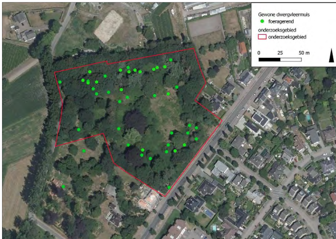
Figuur 5: Waarnemingen van Gewone dwergvleermuis.

In onderstaande kaartjes zijn de locaties van waarnemingen per soort opgenomen.