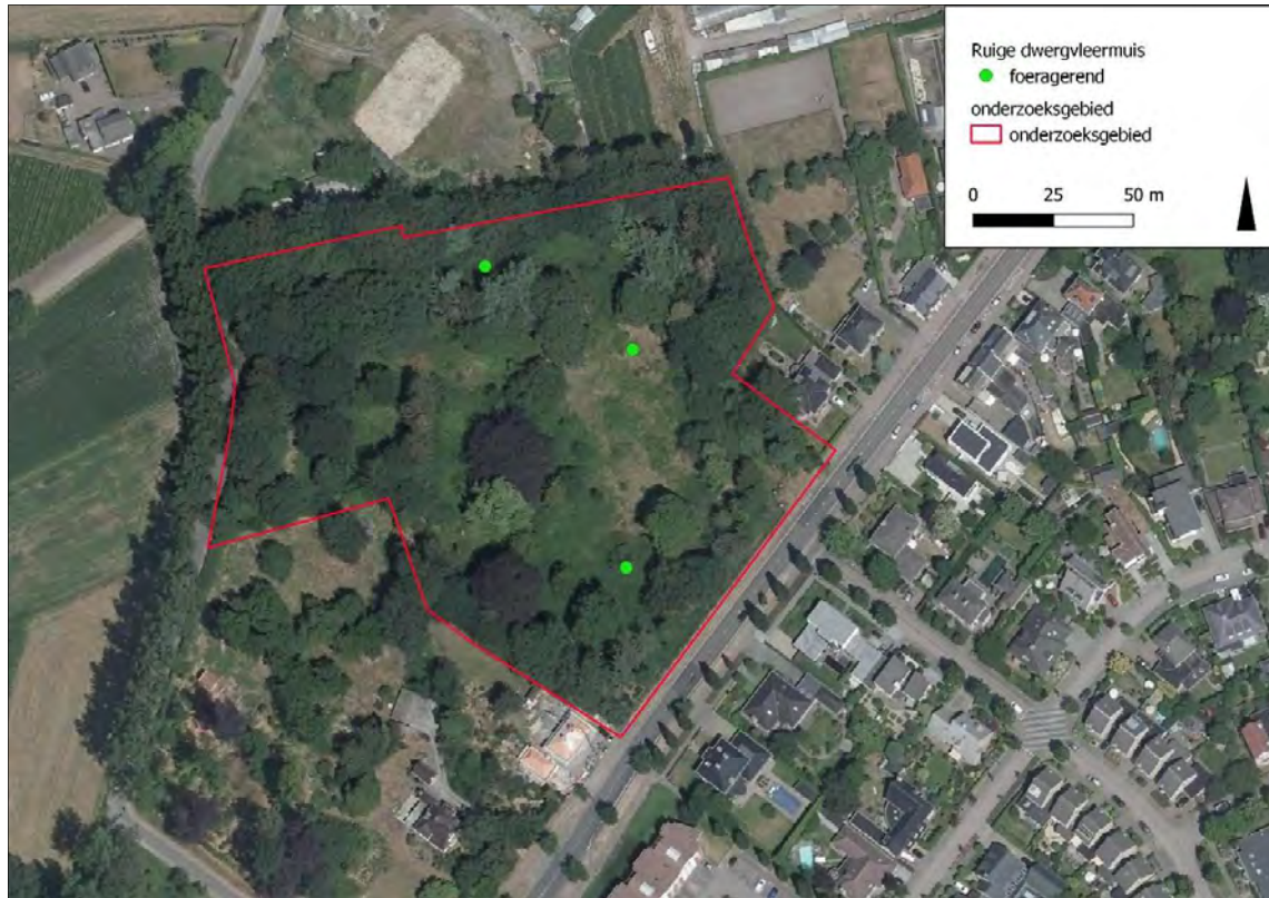
Figuur 6: Waarnemingen van Ruige dwergvleermuis