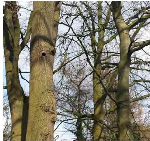
Figuur 3 en 4: Impressie van het onderzoeksgebied.