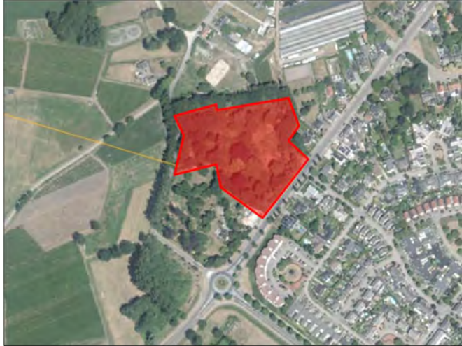
Figuur 1: Ligging van onderzoeksgebied in Valkenswaard (Atlas Brabant, 2019).

In Valkenswaard heeft SDK het voornemen over te gaan tot het ontwikkelen van 11 bouwkavels op het perceel kadastraal bekend als Valkenswaard_D5386. Het terrein, lokaal bekend als het 'Suurlandterrein' ligt al geruime tijd braak; voorheen stond hier een villa. Het plangebied is weergegeven in figuur 1. De voorgenomen ontwikkeling betreft het eventueel nog vellen van bomen en bouwrijp maken van de grond om vervolgens de 11 bouwkavels te verkopen, waarop nieuwe woningen worden gebouwd. Hiertoe is in april 2019 een quickscan beschermde natuurwaarden uitgevoerd (Bureau Meervelt, 2019). Op basis van de quickscan werd een onderzoek naar aanwezigheid van vaste rust- en verblijfsplaatsen van vleermuizen en broedvogels noodzakelijk geacht.