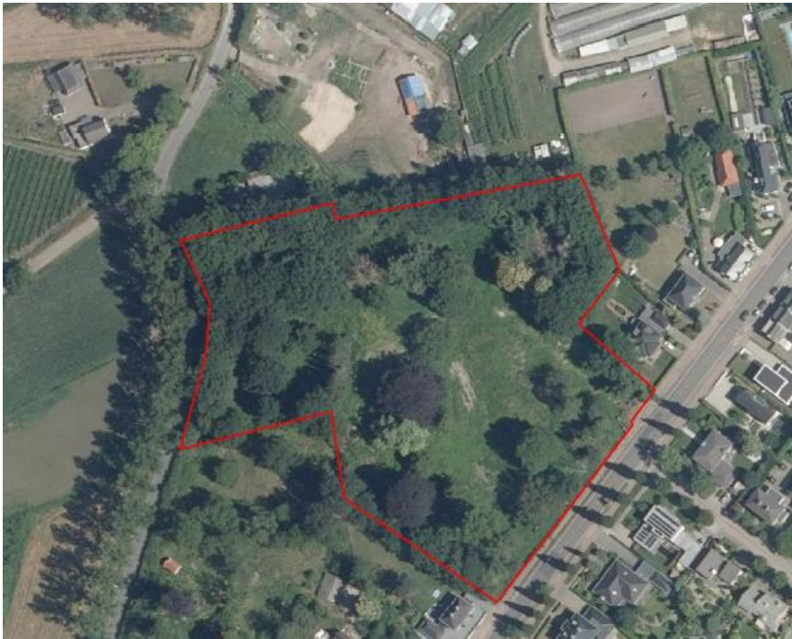
Figuur 1. De onderzoekslocatie.

De onderzoekslocatie, 19.500 m 2 , ligt aan de Luikerweg 100, ongeveer 1,3 kilometer ten zuidwesten van de kern van Valkenswaard in de gemeente Valkenswaard (zie figuur 1). Volgens het Actueel Hoogtebestand Nederland (AHN) bevindt het maaiveld zich op een hoogte van circa 25 meter + NAP. Het gebied is kadastraal bekend als gemeente Valkenswaard, sectie D, nummer 5386. Volgens de topografische kaart van Nederland, 57B (1:25.000), zijn de coördinaten van het midden van het plan-gebied X: 159.341/Y: 372.865.