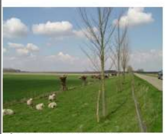
Eén rij jonge bomen met boomkorf