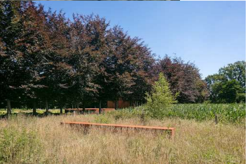
Afbelding 2, beoogde situatie volwassen robuuste Beukenrij