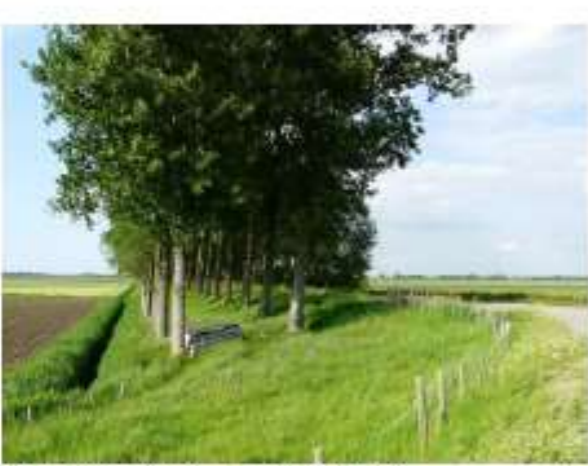
Twee rijen bomen op beweide dijk

Wat is een bomenrij? ➤ Een bomenrij is een één-, twee of meerrijgige beplanting van bomen, niet zijnde knotbomen, die meestal van ongeveer gelijke leeftijd zijn. Een laan is een specifieke vorm van een bomenrij. Er is sprake van een laan als aan beide zijden van een weg één of meer rijen bomen in een regelmatig plantverband geplant zijn. Een bomenrij rij bestaat uit minimaal 2 inheemse loofbomen en de bomen staan in een grasland.