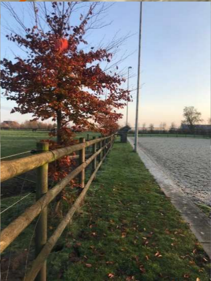
Afbelding 1, bestaande situatie Beuken

Plantvak A: Robuuste bomenrij in het landschap bestaande uit Beuk