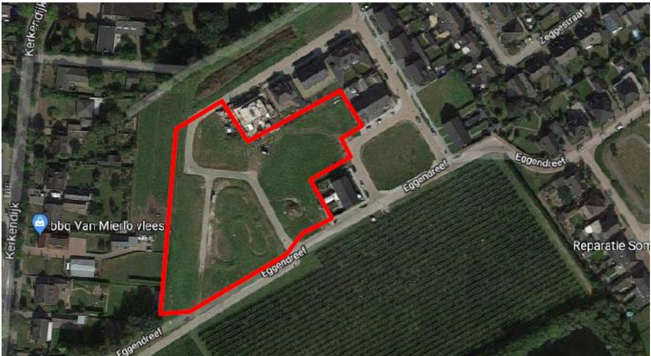
Figuur 4.1. Het plangebied (rood omlijnd).

Het plangebied (zie figuur 4.1 en de foto's op de voorzijde van het rapport) ligt in de bebouwde kom van Someren-Heide. Het is ingericht met kort gemaaid graslandjes, een gazon (met drie recent aangeplante esdoorns) en een waterberging (die begroeid is met gewone waterbies, pitrus en gele lis). Daarnaast zijn er enkele woningen met bijbehorende tuinen. De woningen met tuinen en waterberging blijven behouden en vallen daarom feitelijk buiten het plangebied. De omgeving rondom het plangebied is ingericht met woningen. Aan de zuidzijde bevindt zich een akker, die tijdens het veldbezoek met gras was ingezaaid.