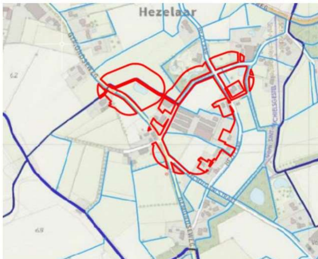
Ligging hoofdwatergangen (donkerblauw) en secundaire watergangen (lichtblauw) met aanduiding plangebied (rode lijn), (bron: waterschap De Dommel, bewerking: SAB)

Tot slot ligt het plangebied deels binnen reserveringsgebied voor waterberging (zie volgende afbeelding).