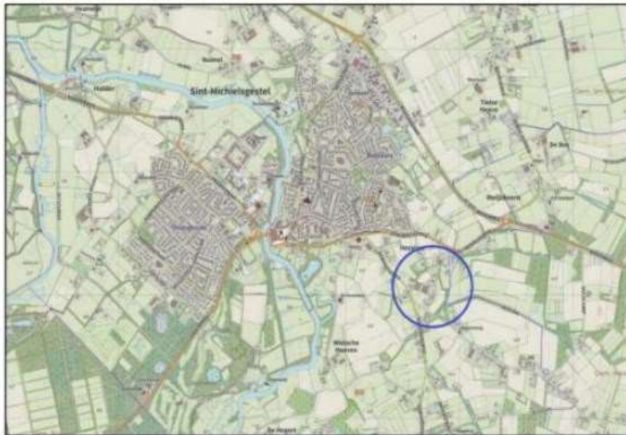
Figuur 1 Ligging plangebied in haar omgeving (in blauw)

In het buurtschap Hezelaar in Sint-Michielsgestel bevindt zich een intensieve veehouderij. Het voornemen is om deze veehouderij te beëindigen en saneren. Hiervoor in de plaats worden 19 nieuwe woningen gerealiseerd, met bijbehorende tuinen/erven, ontsluitingswegen en groenstructuren. De ontwikkeling is niet mogelijk binnen het vigerende bestemmingsplan 'Buitengebied Sint-Michielsgestel'. Om die reden is een nieuw bestemmingsplan in voorbereiding.