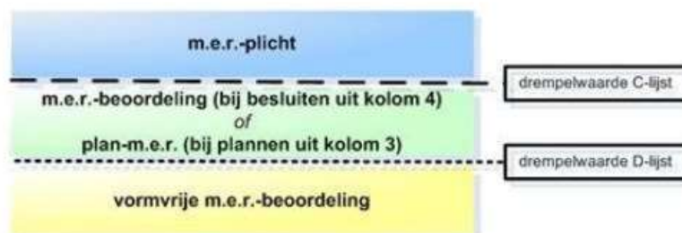
Schema m.e.r.-plicht vanwege Besluit m.e.r.

De milieueffectrapportage (hierna: m.e.r.) is een hulpmiddel om het milieubelang een volwaardige plaats te geven in de besluitvorming. De wettelijke basis voor de m.e.r. is de Wet milieubeheer. In de uitvoeringswetgeving, het Besluit m.e.r., staat wanneer een m.e.r. of (vormvrije) m.e.r.-beoordeling aan de orde is. De activiteit die het project mogelijk maakt, de omvang ervan en het besluit over de activiteit zijn daarbij bepalend. In de onderdelen C en D van de bijlage bij het Besluit m.e.r. staat of sprake is van m.e.r.-plicht of (vormvrije) m.e.r.-beoordelingsplicht. Per categorie van activiteiten is een drempelwaarde voor de omvang van de activiteit gegeven.