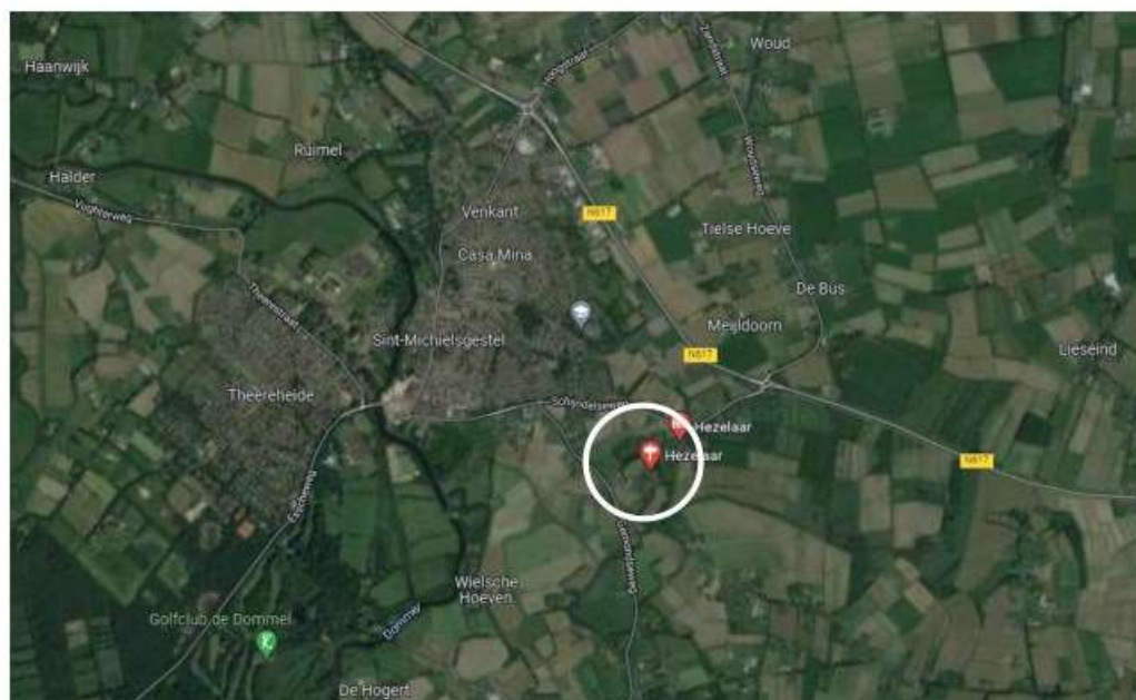
Figuur 5: Luchtfoto met globale ligging plangebied

Het plangebied bevindt zich tussen de Schijndelseweg/Gestelseweg en de Gemondseweg/Nachtegaalstraat. Het ligt ten zuidoosten van Sint-Michielsgestel, buiten de bebouwde kom. In onderstaande afbeelding is de locatie van het plangebied weer- geven.