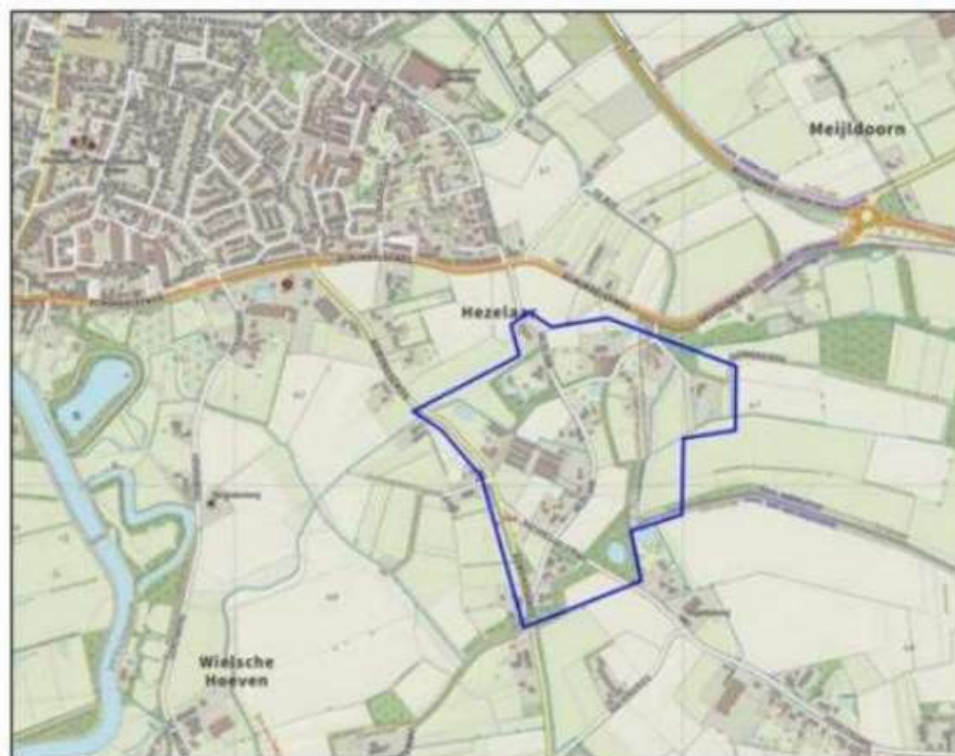
Figuur 2 Globale plangrenzen ontwikkeling (in blauw)