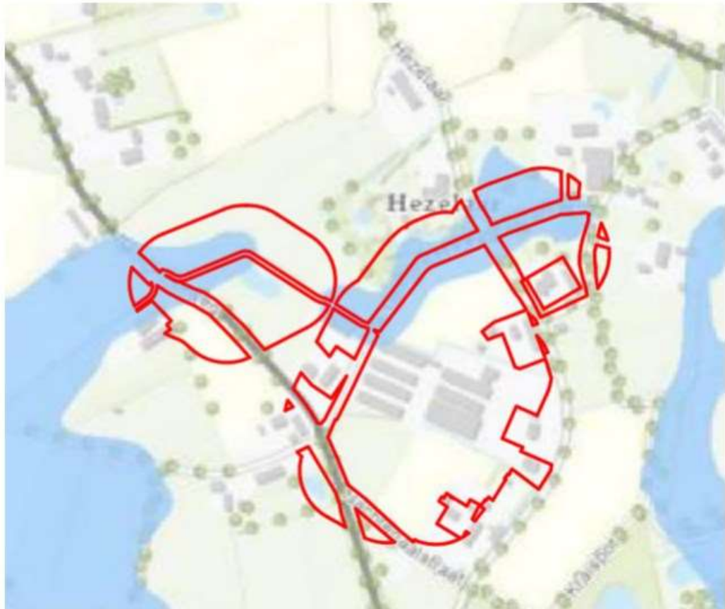
Reserveringsgebied waterberging met aanduiding plangebied (rode lijn), (bron: waterschap De Dommel, bewerking SAB)