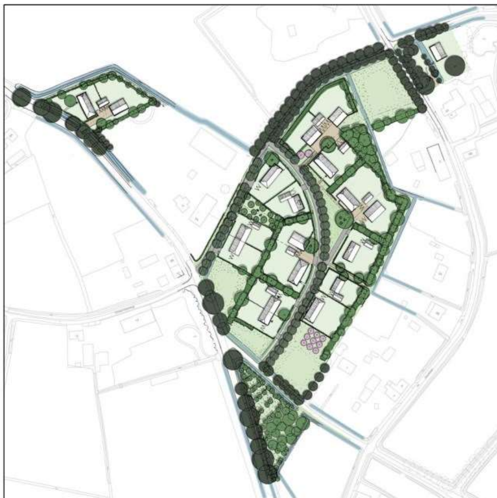
Figuur 4: Stedenbouwkundig plan

Het plan betreft de beëindiging van de intensieve veehouderij en de sloop van de aanwezige bedrijfsbebouwing. Op de gronden van de intensieve veehouderij en een aantal kavels in de directe omgeving worden in totaal 19 nieuwe woningen gerealiseerd. De huidige bedrijfswoning wordt omgezet naar een burgerwoning. Verder vindt een ambitieuze versterking van de landschappelijke kwaliteiten plaats. Voor de ontsluiting van de nieuwe woningen wordt een nieuwe weg door het plangebied aangelegd. Voor het plangebied is een stedenbouwkundig plan en beeldkwaliteitsplan opgesteld. Figuur 4 laat het stedenbouwkundig plan zien.