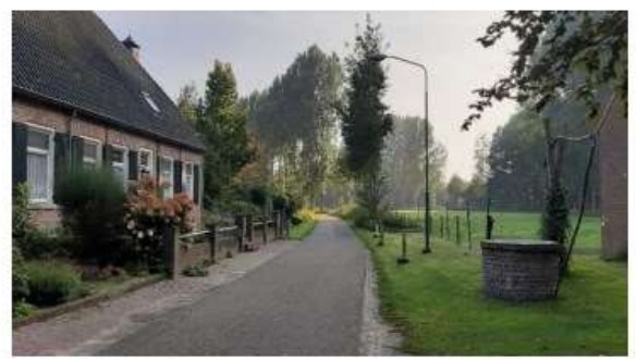
Beeld van de straat Hezelaar