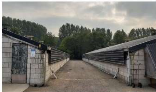
Te saneren opstallen

De aanwezigheid van vaste rust- en verblijfplaatsen van vleermuizen in de te saneren opstallen en aanwezigheid van vliegrouetes en foerageergebied is niet uit te sluiten. Aanvullend onderzoek naar verblijfplaatsen, vliegrouetes en foerageergebied van vleermuizen moet uitgevoerd worden.