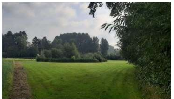
Perceel 190 met poel