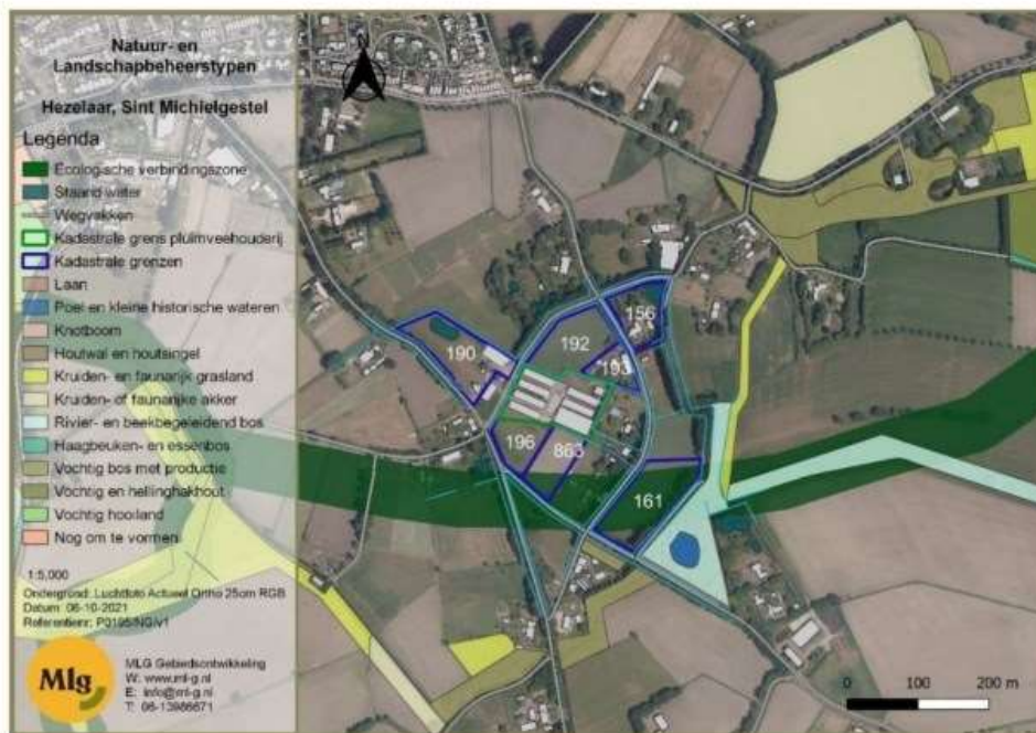
Figuur 3 Overzicht NNB en ligging zoekgebied EVZ nabij plangebied