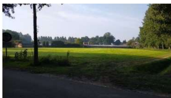
Perceel 192 en de te saneren stallen

Onderstaande foto's geven een overzicht van de huidige situatie van het plangebied en de naaste omgeving.