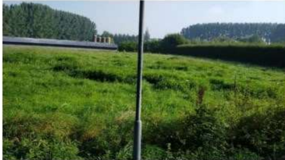
Perceel 196 en te saneren stallen