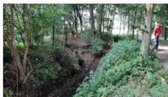
Droge watergang ten noorden van perceel 156