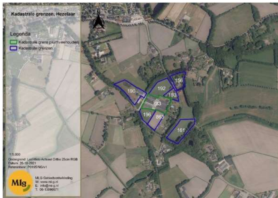
Figuur 2 Kadastrale begrenzing van het plangebied

In figuur 2 zijn de kadastrale grenzen te zien van de percelen waar gebouwd gaat worden (blauw omlijnd). In het groen omlijnd is de grens van de pluimveehouderij aangegeven, de opstallen worden gesaneerd en bestaande hagen en andere erfafscheiding worden verwijderd.