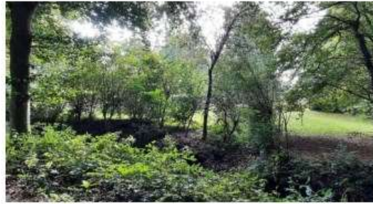
Groenstructuren aan de randen van de percelen binnen het plangebied