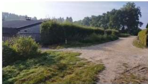
In potentie geschikte verblijfplaatsen voor huismus onder golfplaten daken en in erfbeplanting