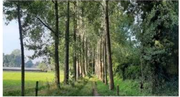
Laan ten noorden van perceel 192