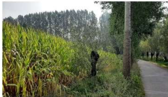
Perceel 863, maisakker