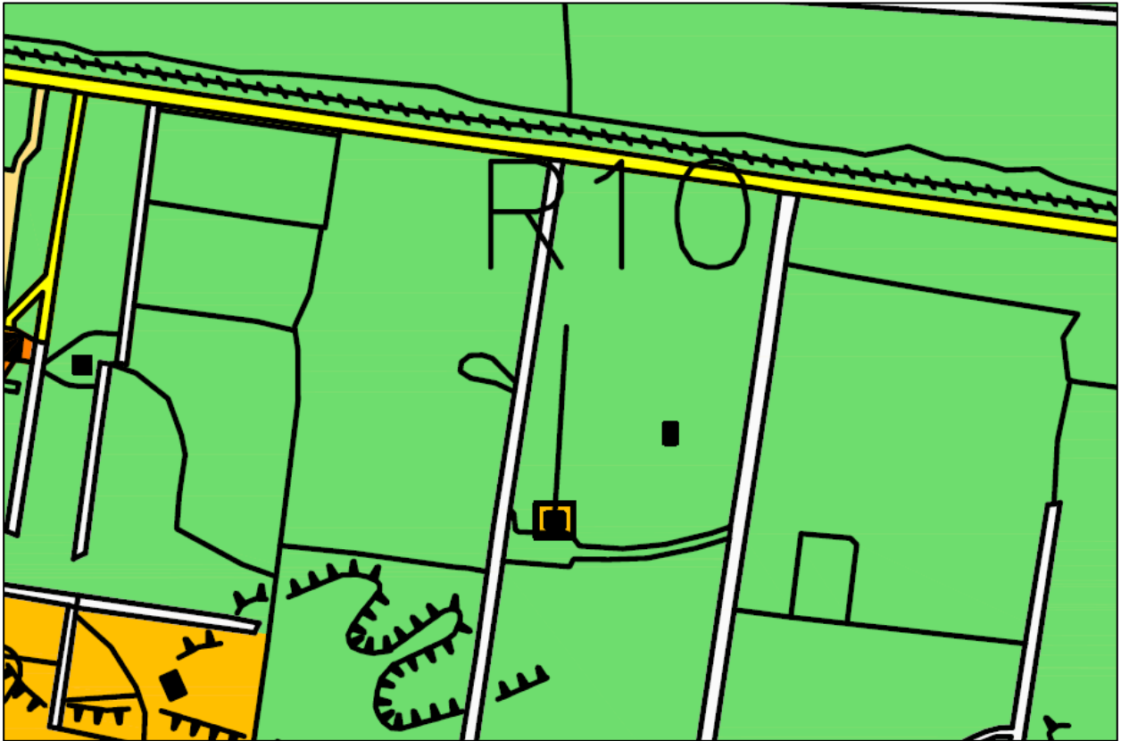
Figuur 3: Uitsnede verbeelding bestemming 'Recreatieve doeleinden' met aanduiding 'recreatiewoning'.