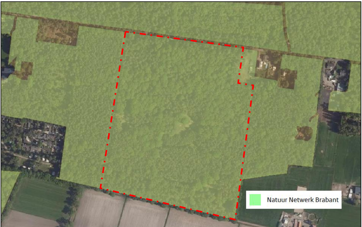
Figuur 1: Uitsnede kaart 4 Interim omgevingsverordening Noord-Brabant: natuur en stiltegebieden. Het plangebied is met rood omlijnd.

bosbouw. In het bos is één recreatiewoning aanwezig. Deze is bestemd met de bestemming 'Recreatieve doeleinden' met een functieaanduiding 'recreatiewoning'. Deze woning is gelegen in een bouwvlak met een oppervlakte van (20 x 20 =) 400 m 2 .