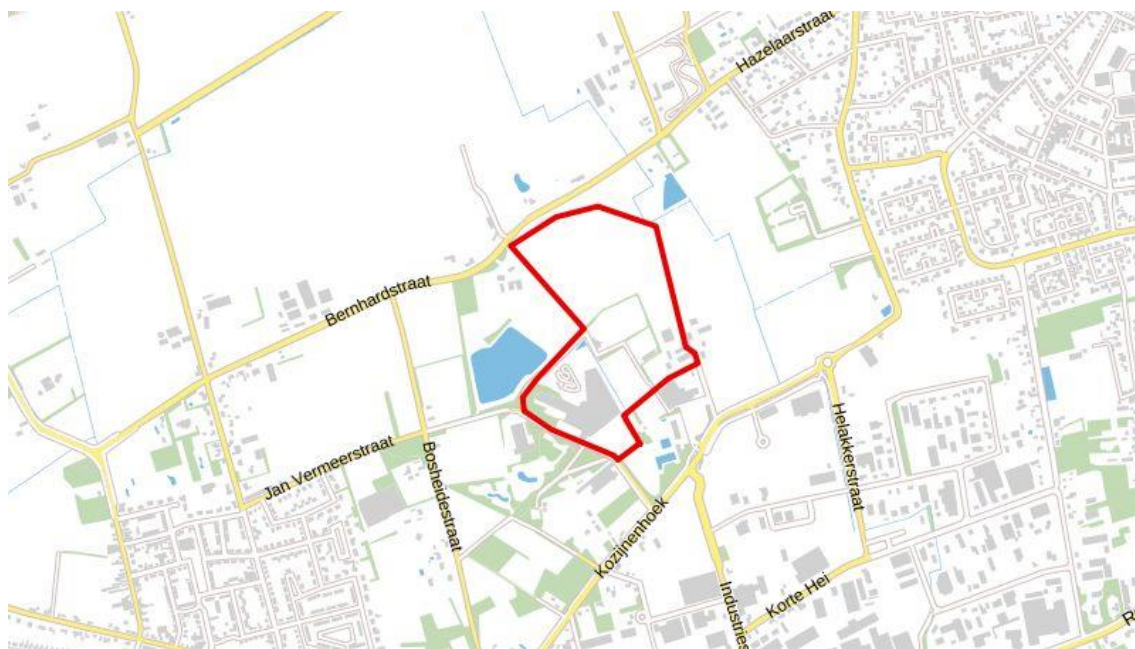
Figuur 1 Ligging van het plangebied, met de begrenzing in rood aangegeven.

Het plangebied is gelegen in Rucphen, in de provincie Noord-Brabant. In Figuur 1 is de begrenzing van het plangebied weergegeven. Het plangebied betreft de Skidome, sportaccomodatie, parkeerplaatsen, bebouwing en agrarisch bouwland.