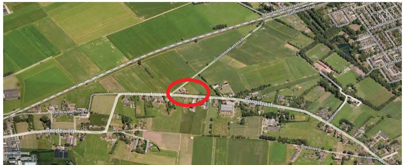
Locatie aangegeven op luchtfoto (googlemaps / bingmaps)