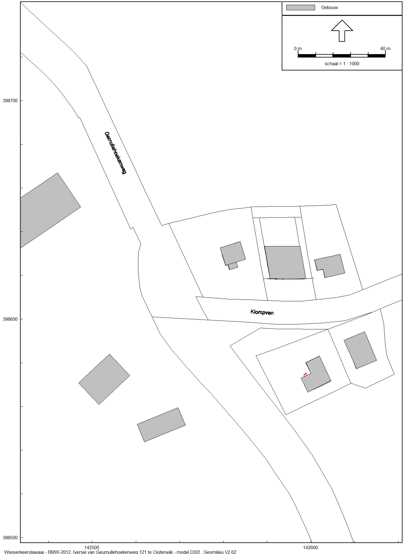
figuur 1 situatietekening