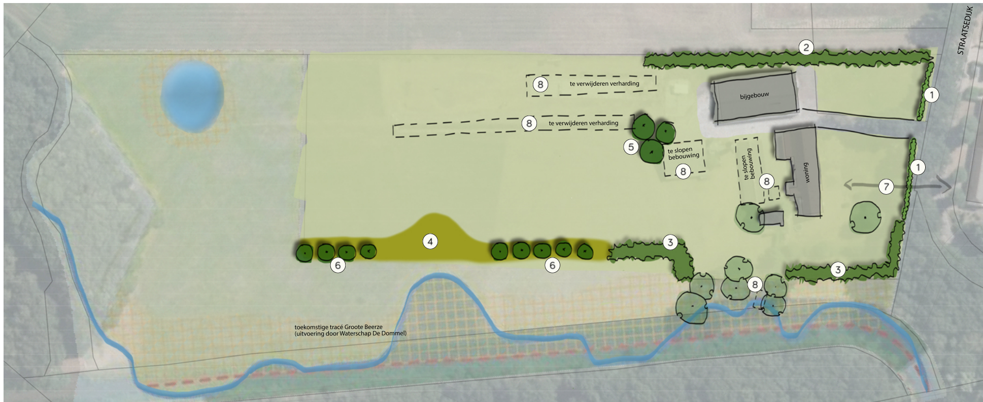
Landschappelijk inpassingsplan Straatsedijk 6, Westelbeers