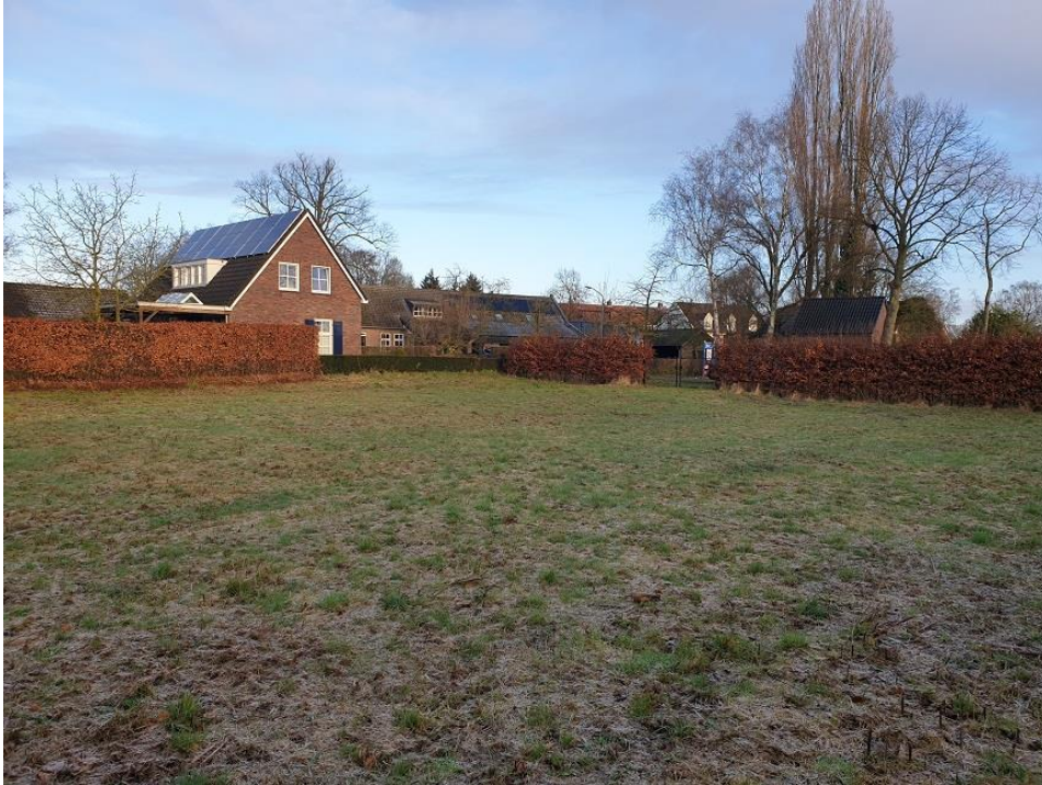
Foto 1. Impressie van het plangebied, vanuit de zuidoosthoek in noordwestelijke richting gezien; de heggen op de achtergrond vormen de begrenzing van het plangebied.