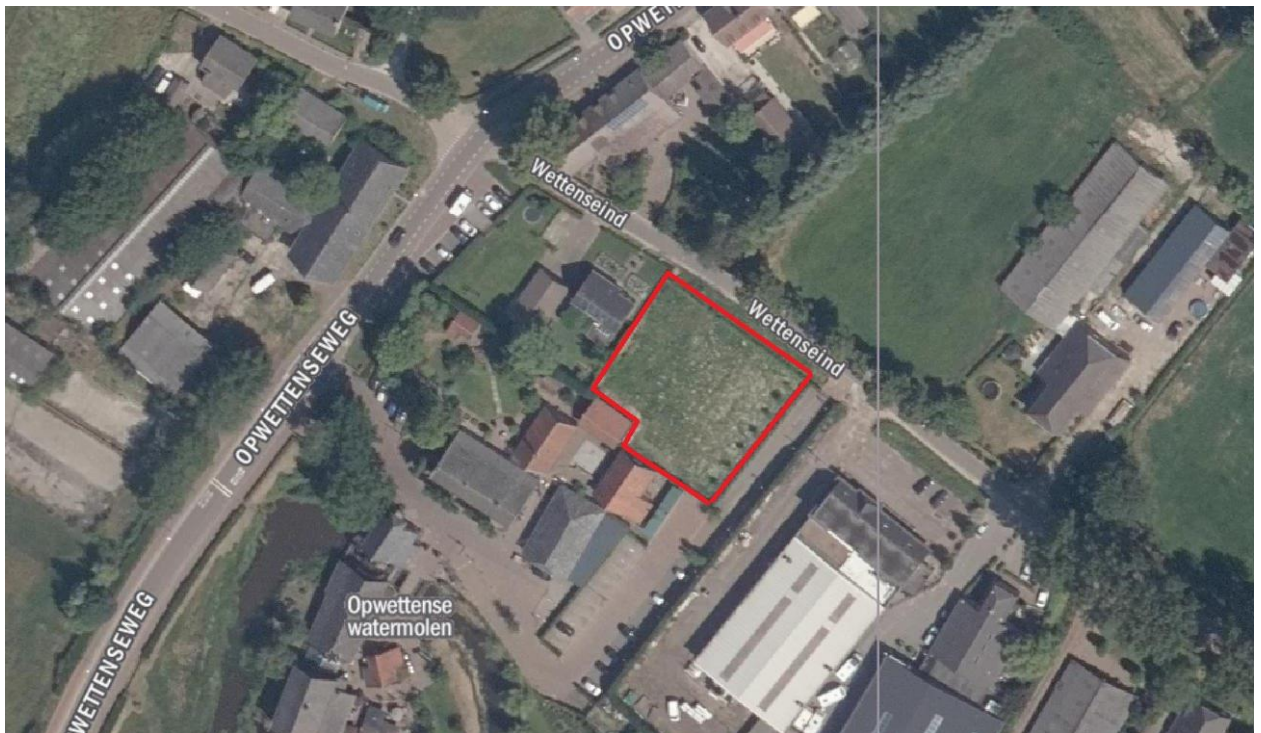
Locatie plangebied in de weide naast Wettenseind nr2 bij Nuenen.