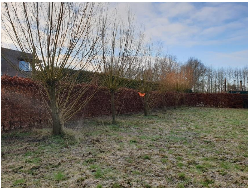
Foto 2. Het rijtje wilgen in het oostelijk deel van het plangebied, gezien in zuidelijke richting; de heg links vormt de oostelijke begrenzing van het plangebied.