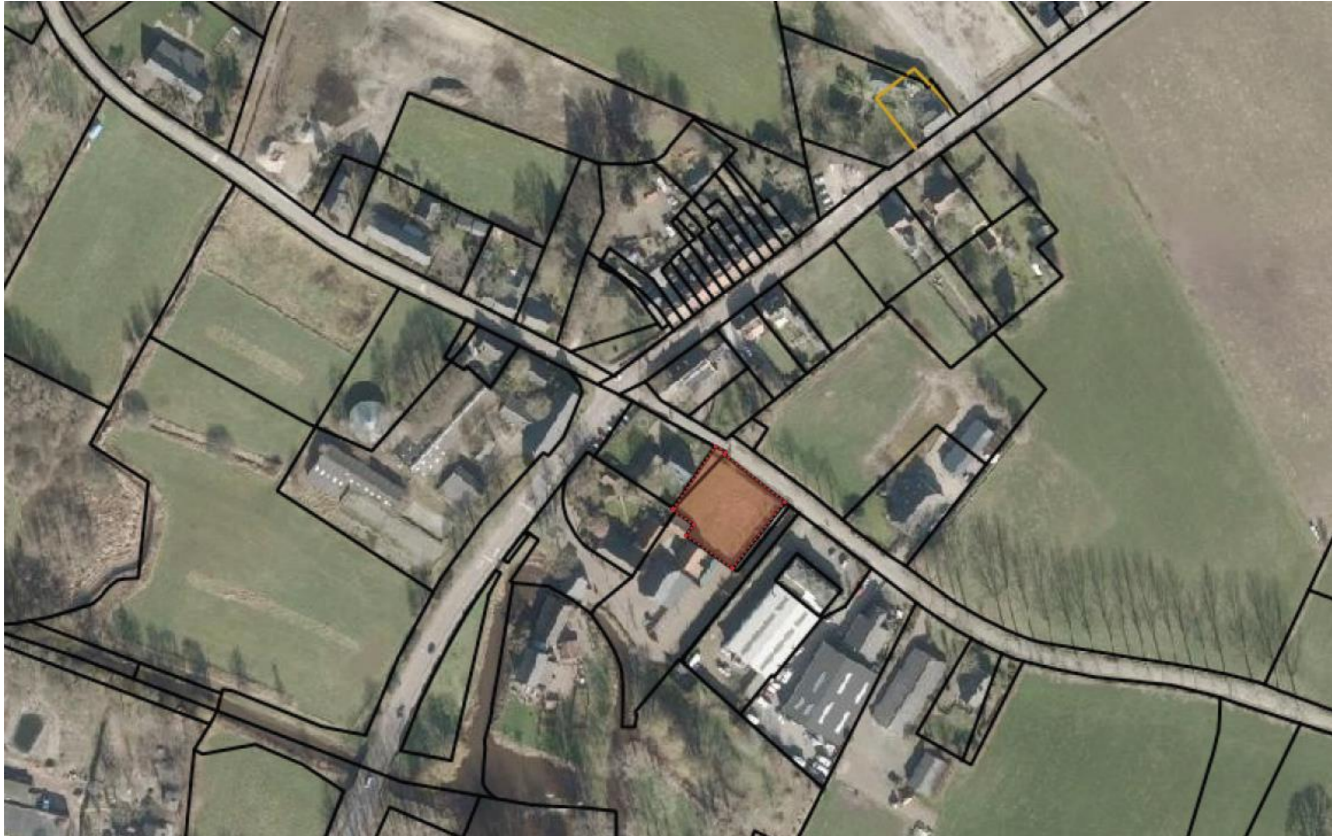
Kavel Wettenseind Nuenen