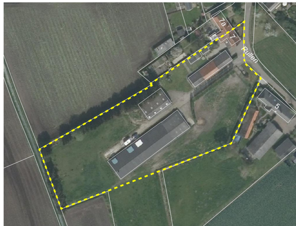
1.2 LUCHTFOTO PLANGEBIED EN DIRECTE OMGEVING