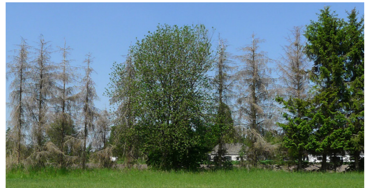
1.4 BESTAANDE ERFAFSCHEIDING