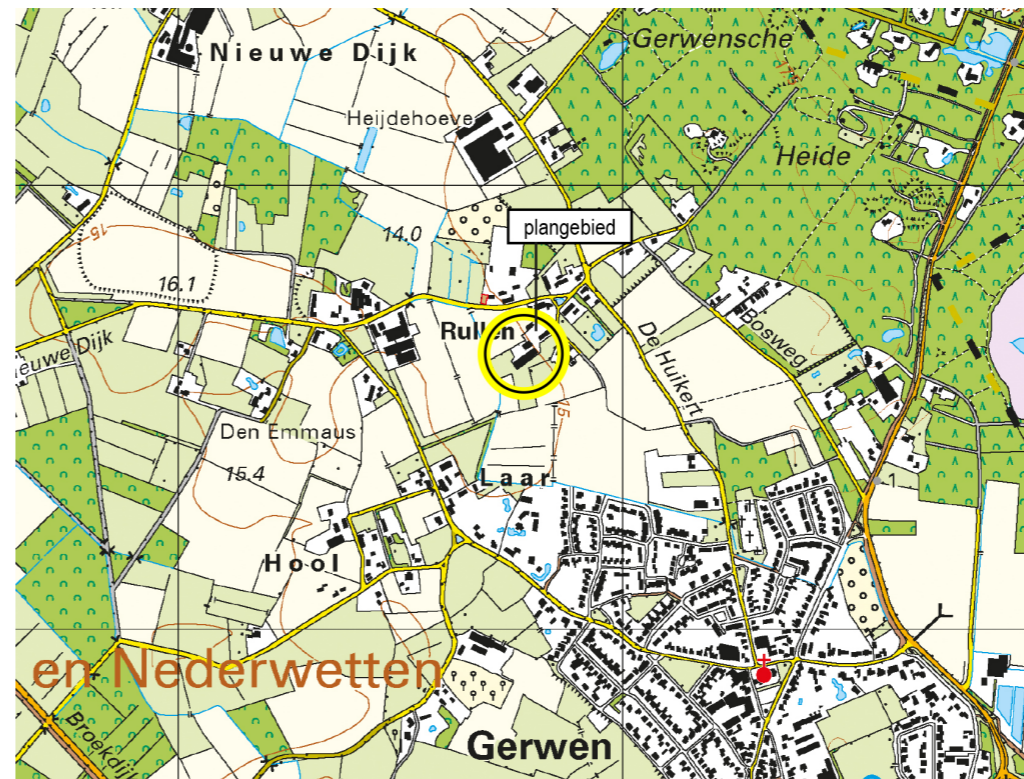
1.1 TOPOGRAFISCHE SITUATIE

Voor het plangebied en directe omgeving geldt dit ook: de kleine percelen zoals zichtbaar op de kadastrale minuut rondom Rullen, ook in het akkerlandgebied direct ten westen van het plangebied, zijn veelal verdwenen. In de huidige situatie is het plangebied functioneel ingericht als agrarisch bedrijf. Enkel langs de perceelsgrenzen staan bomenrijen (voornamelijk dennen) die zorgen voor een afscherming van het plangebied. De inrit wordt begeleid door een bomenrij. Ten westen van het plangebied loopt een A-watgang. Binnen het plangebied liggen enkele schouwsloten.