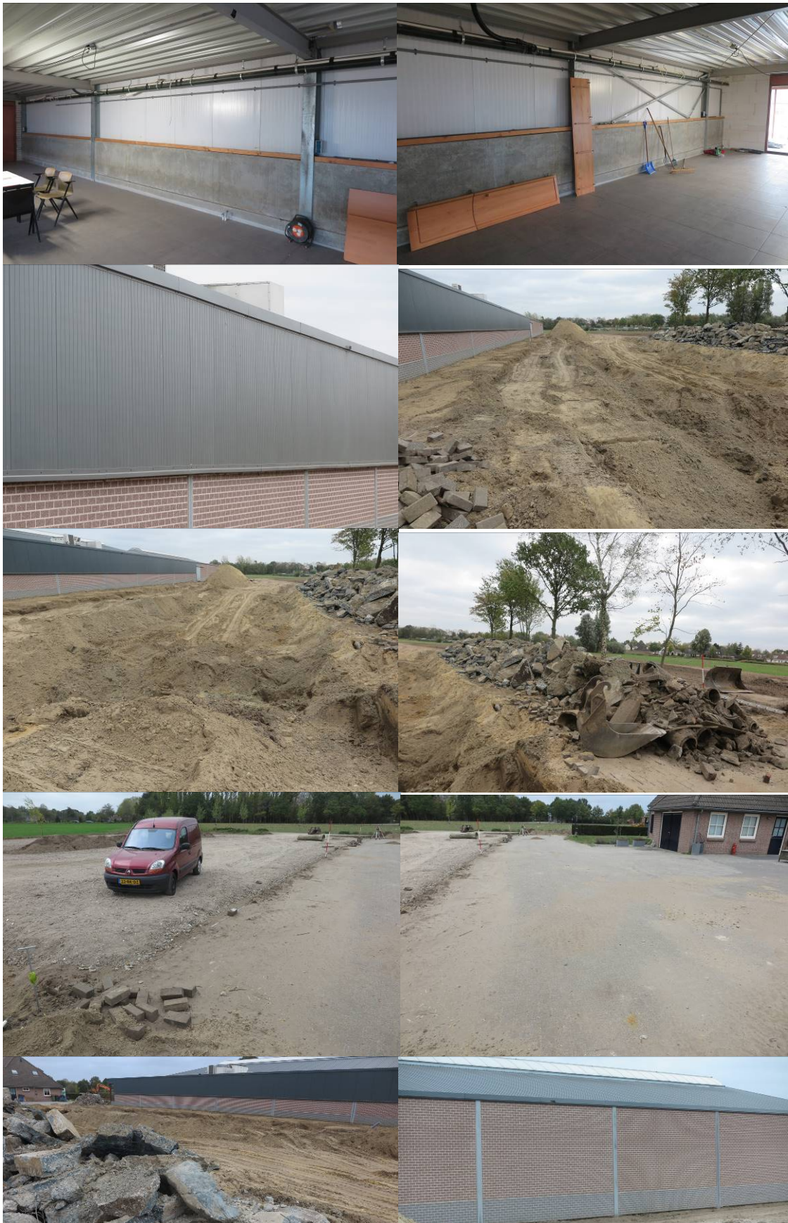
Figuur 2. Foto-impressie van het plangebied aan de Alvershool 1 te Nuenen.