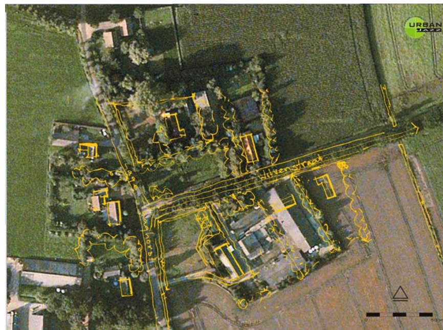
INPASSING 2 -RUIMTE VOOR RUIMTE- KAVELS WITVENSTRAAT, HAGHORST