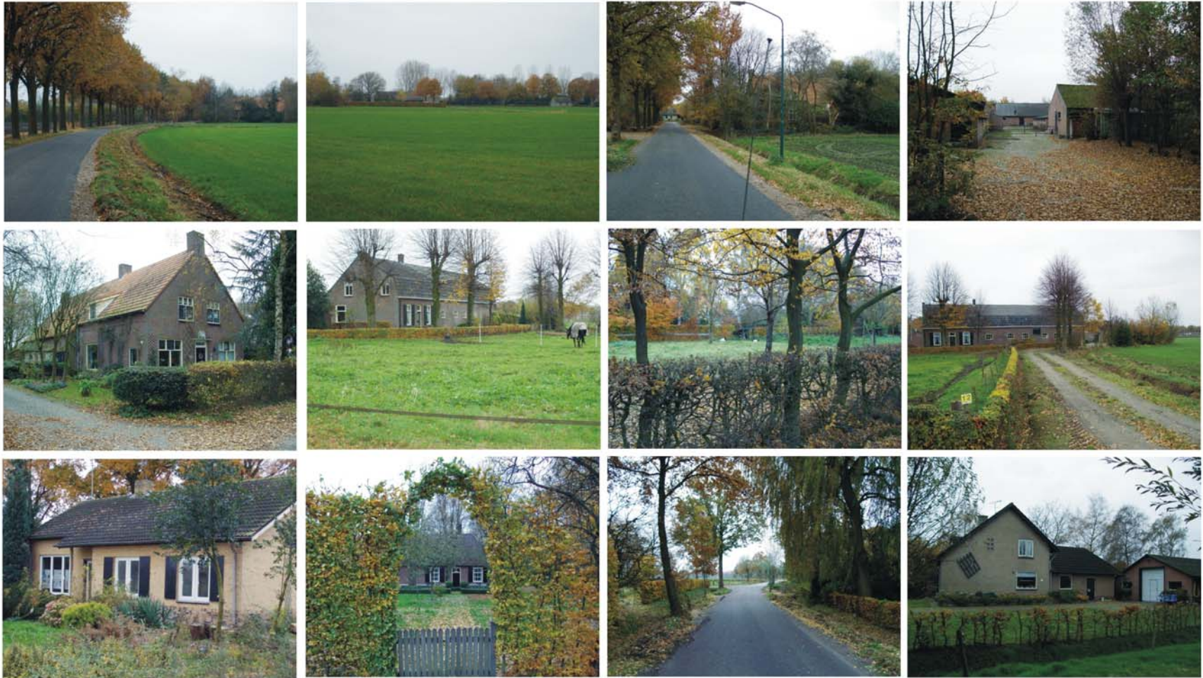
BESTAANDE SITUATIE CLUSTER LAGE HAGHORST/WITVENSTRAAT