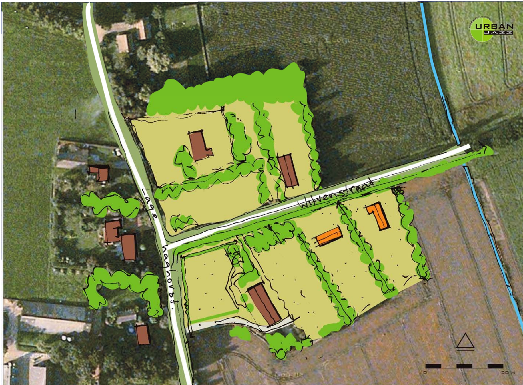
INPASSING 2 -RUIMTE VOOR RUIMTE- KAVELS WITVENSTRAAT, HAGHORST