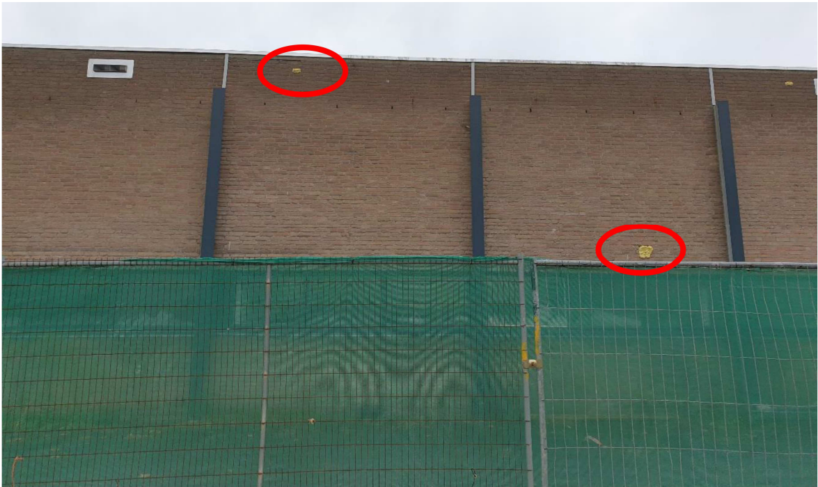
Foto 2, gaten oostzijde muur dicht gemaakt met pur schuim.

Foto 1, oostzijde muur geschikt voor vleermuizen. De grote openingen zijn met pur schuim dicht gemaakt (rode cirkels).