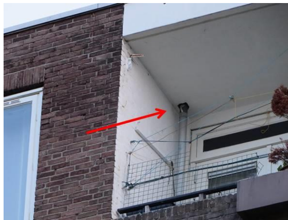
Foto 2A en B. Overzicht en detail van locatie invlieger gewone dwergvleermuis aan voorzijde gebouw Voltastraat, 19 augustus 2019.