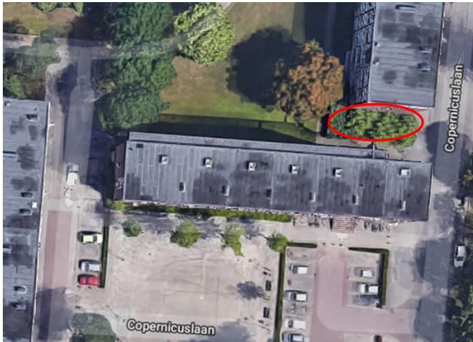
Foto 4. Copernicuslaan, locatie van werfroep gewone dwergvleermuis langdurig waargenomen maar niet continu, 22 september 2019.