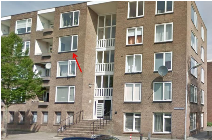
Foto 1. Een gewone dwergvleermuis meerdere malen aantikkend onderzijde raam gebouw Voltastraat, niet zien invliegen, 01 juli 2019.