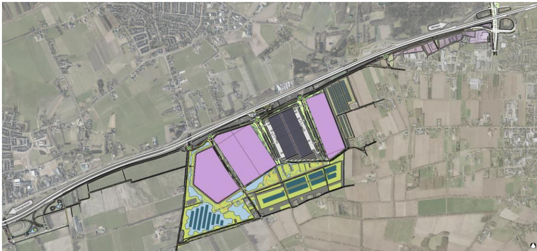
Figuur 1: Stedenbouwkundig ontwerp regionaal bedrijventerrein Heesch-West

De Commissie adviseert deze informatie in een aanvulling op het MER op te nemen, en dan pas een besluit te nemen over de bestemmingsplannen. In hoofdstuk 2 licht de Commissie haar oordeel toe en geeft ze aandachtspunten voor het vervolgtraject.