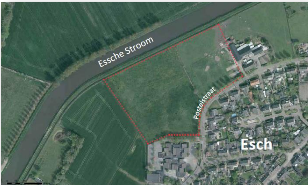
Figuur 2 Begrenzing plangebied, Postelstraat te Esch