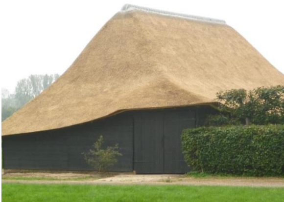
Referentiefoto Vlaamse schuur Liempde

De hoofdkleurtoon en het overwegend materiaalgebruik dienen afgestemd te zijn op het agrarische bedrijf aan de Winkelsestraat 33 en de karakteristieken van een Vlaamse schuur in deze agrarische omgeving. Natuurlijk materiaalgebruik staat hierbij voorop.