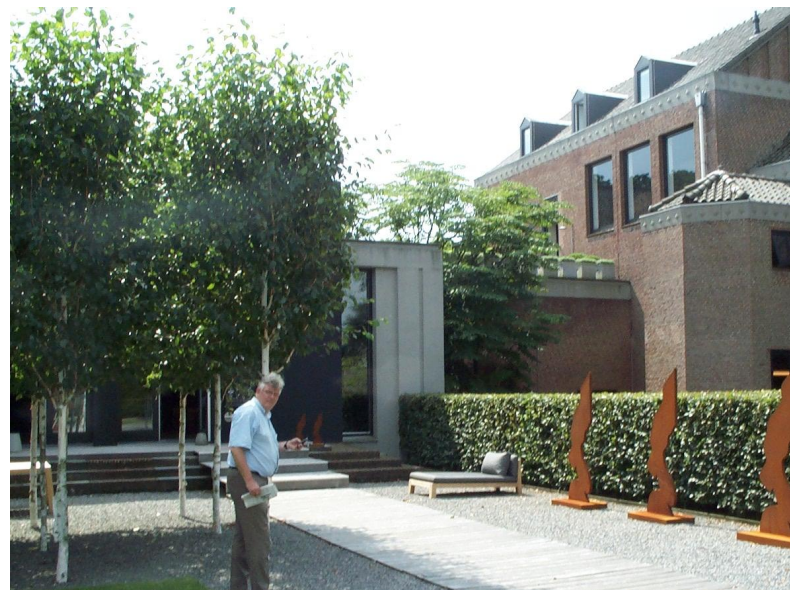
witte tegels, etc.

Reeks klaslokalen in vleugel praktijklokalen (oostzijde) heden ingericht als toonzalencomplex en werkplaats. Overige ruimtes nog goed herkenbaar als onderdeel schoolruimtes voor leerlingen met o.a. toiletten, wasruimtes met lambriseringen met