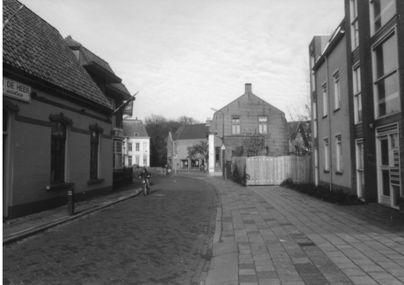
Kerkstraat, richting Bisschop de Vetplein 1998

De dorpskern van Gilze kent een specifiek karakter dat haar doet afwijken van de doorsnede dorpskernen in Noord-Brabant. In de kern van Gilze hebben wij niet te maken met een ruime marktplaats waaraan kerk en stadhuis zijn gelegen. Ter hoogte van het huidige Bisschop de Vetplein