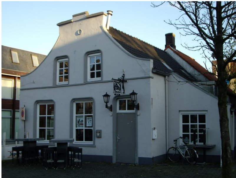
uitgevoerd door de architect G.H.B. van de Grolsch Bierbrouwerij.

1987. Het object wordt in opdracht van de heer A.P.J.M. van Enschoot opnieuw verbouwd. De grote woon/achterkamer wordt bij het café getrokken en bestemd tot zaaltje. Aan de zuidzijde wordt in de uit/aanbouw een buffet ingericht. De toiletten van 1956 worden bij de buffetruijme getrokken, terwijl nieuwe toiletten ernaast in de voormalige bergruimte worden aangelegd. De overgebleven ruimte van de berging wordt nu woonkamer met uitzicht op de Kerkstraat. De keuken naast het zaaltje achter in het café blijft bestaan, maar wordt wel gemoderniseerd. De werkzaamheden worden