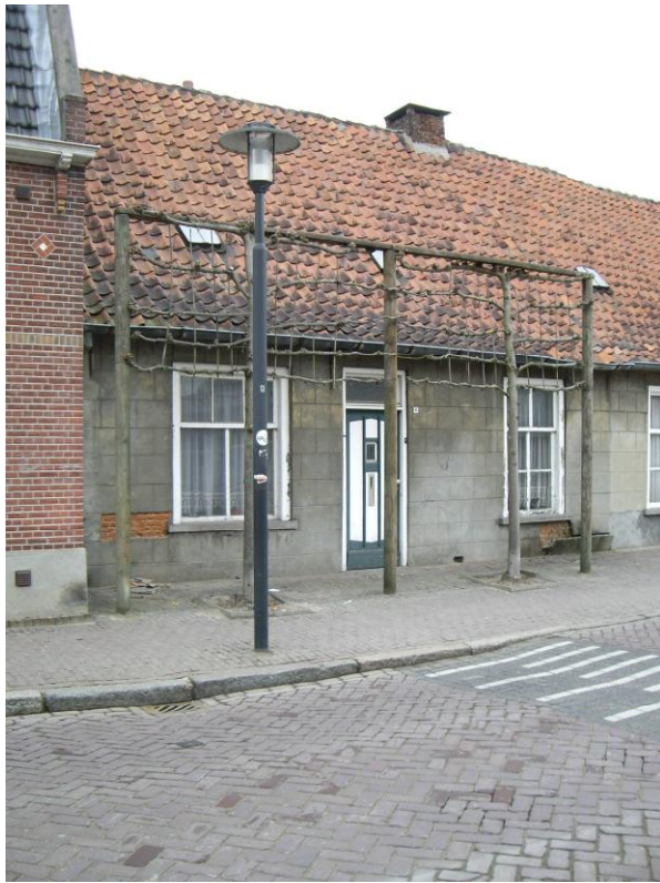
rusticamotief (motief rusticablokken). Plattegrond: Rechthoekig. Stijl: ----