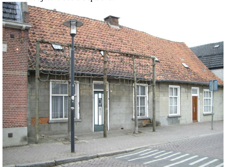
Nr.4 en 6