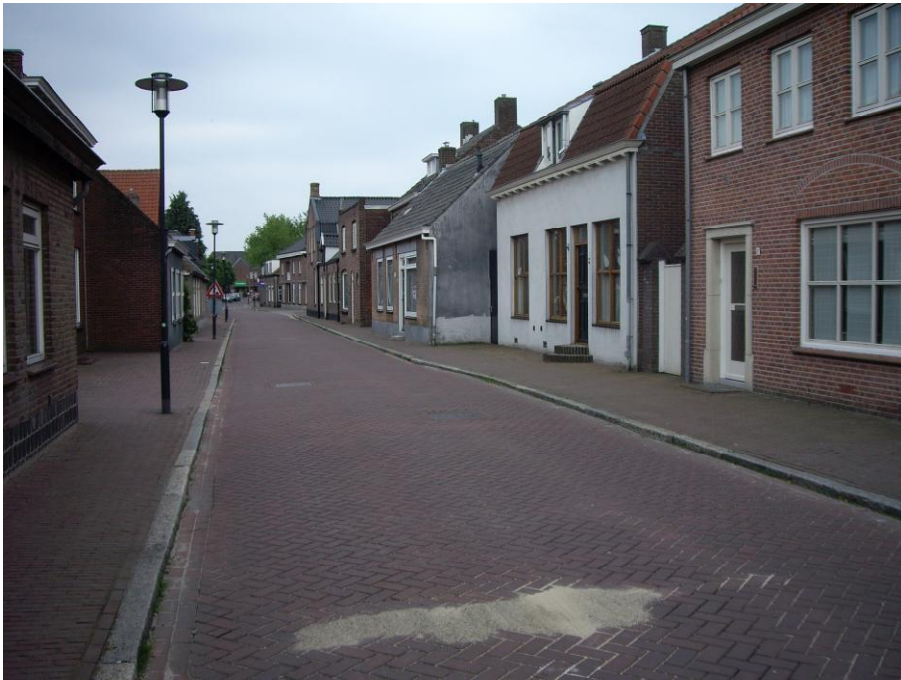
Oranjestraat, richting Bisschop de Vetplein 2012