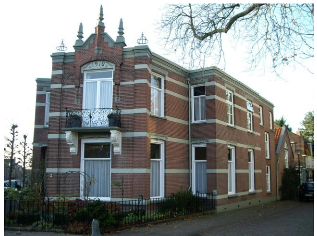
Het hoofd object met twee bouwlagen heeft een