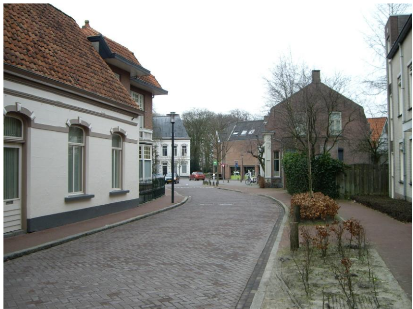
Kerkstraat, richting Bisschop de Vetplein 2012

de blik steeds ruimer wordt en grotere voortuinen voorkomen. En zo ontstaat de situatie dat wanneer men het dorp Gilze op afstand ziet men de toren van de kerk als centrum van de kern ervaart, terwijl wanneer men het dorp binnenrijdt dit centrum wordt gevormd door het Bisschop de Vetplein. Voor Gilze is dit specifieke karakter van de dorpskern zeer de moeite waard om te beschermen.