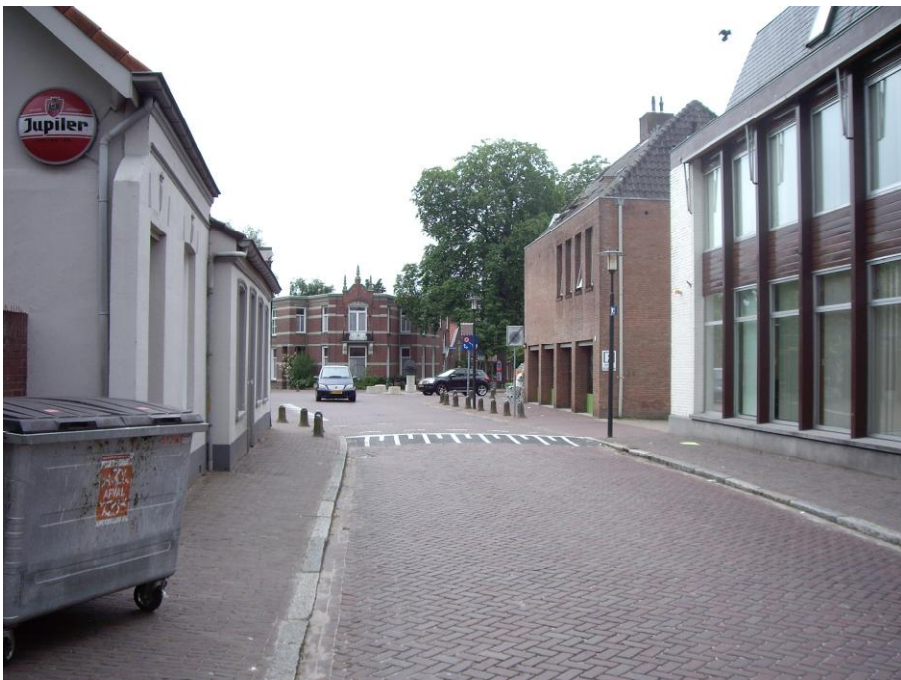
Raadhuisstraat, richting Bisschop de Vetplein 2012