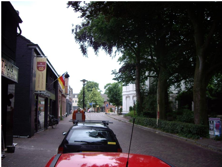
Nieuwstraat, richting Bisschop de Vetplein 2012