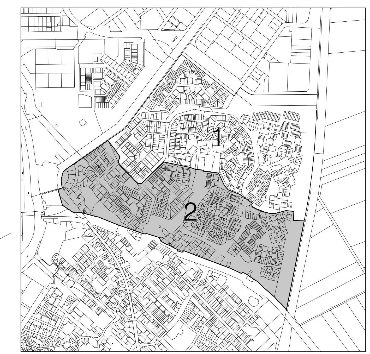
Gemeente Geertruidenberg Bestemmingsplan "Raamsdonksveer Noord" Plankaart deelgebied 2