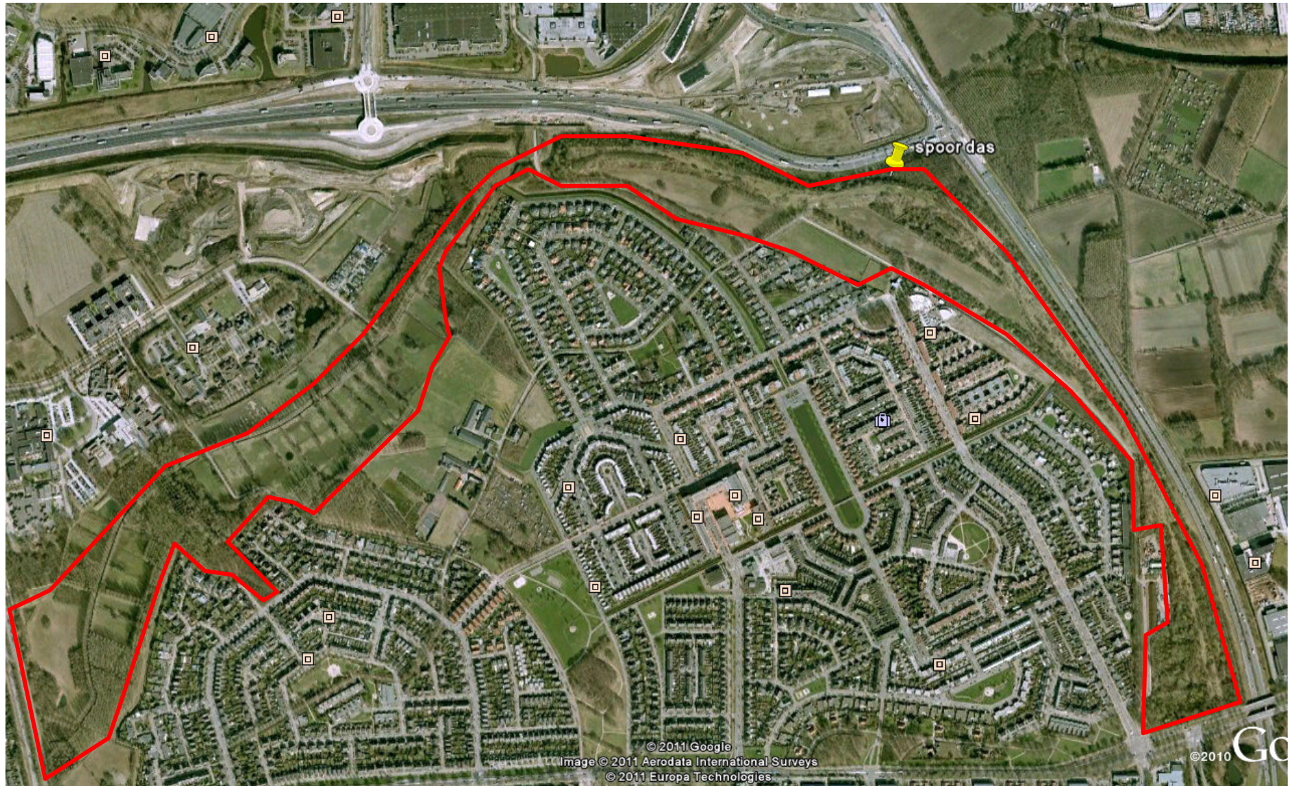
Rood omlind: het onderzochte gebied.