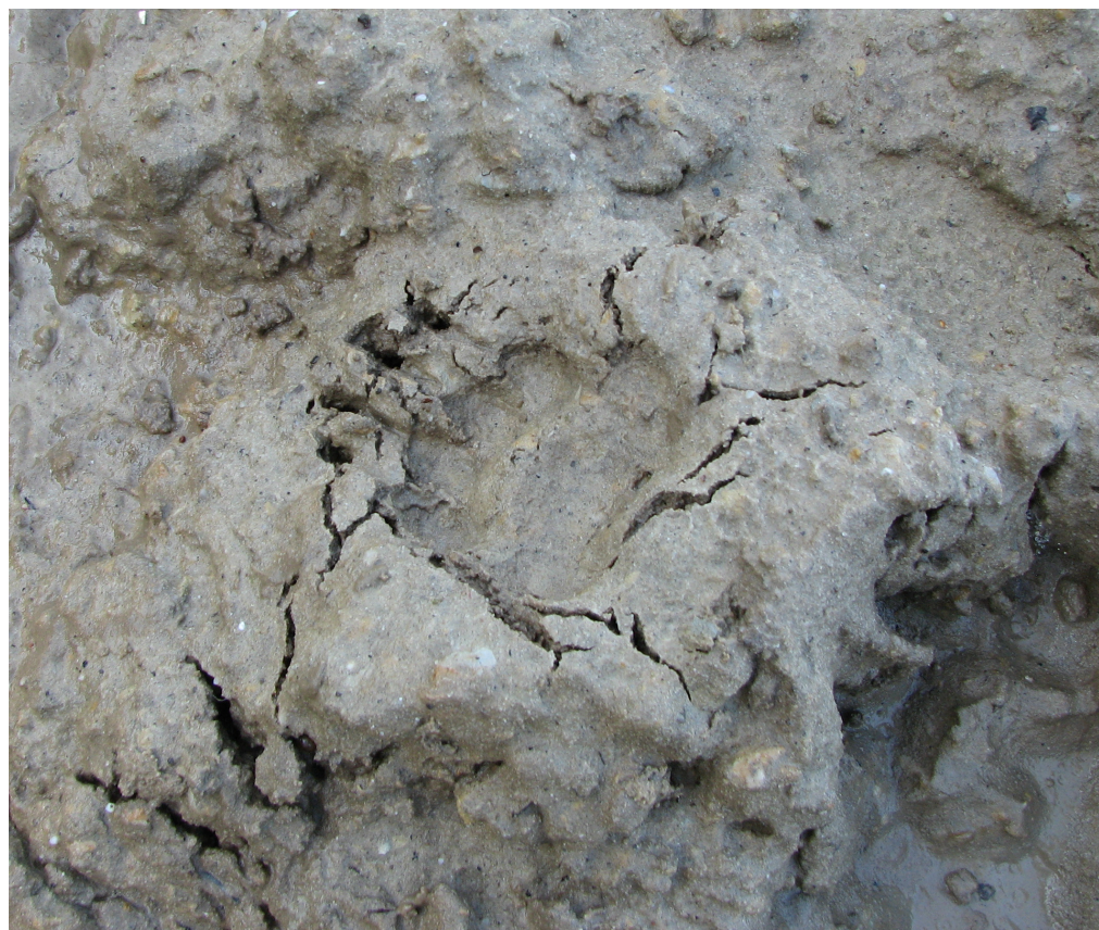
Figuur 2 Dassenprent bij Blixembosch