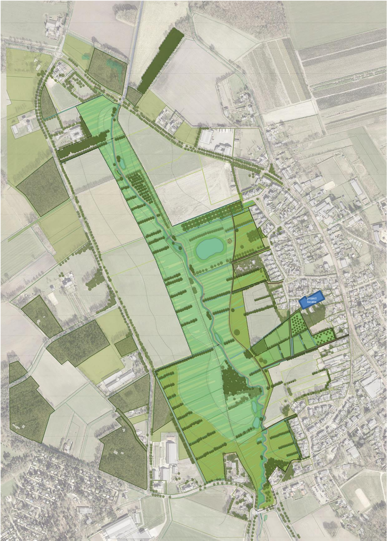
Plan Dorp aan de beek, in blauw is de projectlocatie aangegeven.