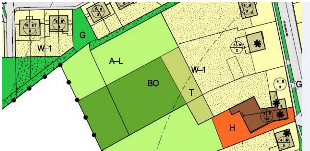
Bestemmingsplan Kom Vessem, Wilhelminalaan 25 Vessem

Het perceel waarop de twee recreatiewoningen zijn gepland hebben in het huidige Komplan Vessem de bestemming Agrarisch met Landschappelijke waarde (A-L). Het perceel ligt opgesloten tussen een groenbestemming (G met landschappelijke inpassing) en een bosperceel (BO). Op het betreffende perceel (A-L) staan twee bouwwerken. Een schaapskooi die als trainingsruimte wordt gebruikt en een opslag voor hout en tuingereedschap. De bouwwerken zijn per abuis niet bestemd in het Komplan Vessem. De schaapskooi is in het verleden met bouwvergunning gebouwd. Het perceel (A-L) wordt niet als agrarisch landbouwperceel gebruikt maar is feitelijk de uitloop van de tuin behorend bij Wilhelminalaan 25. De feitelijke bestemming komt dus niet overeen met het feitelijke gebruik.