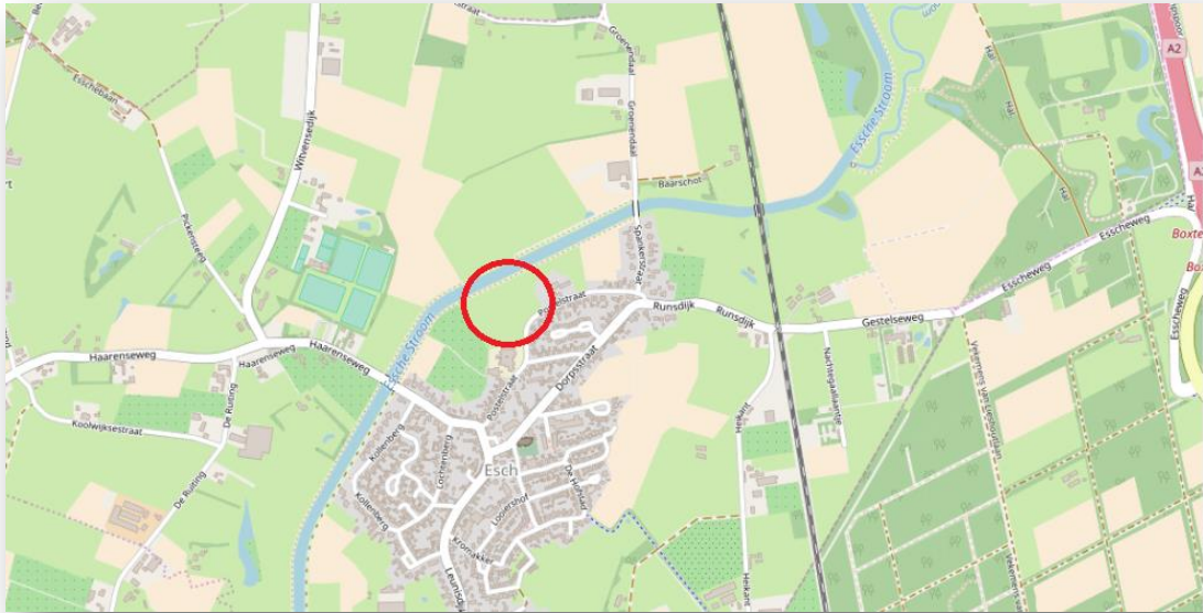
Figuur 1 Ligging plangebied ten opzichte van de omgeving