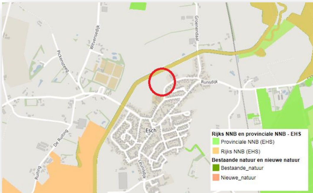
Figuur 5. Natuurbeheerplan 2018 met de aangewezen NNB-gebieden rondom plangebied.