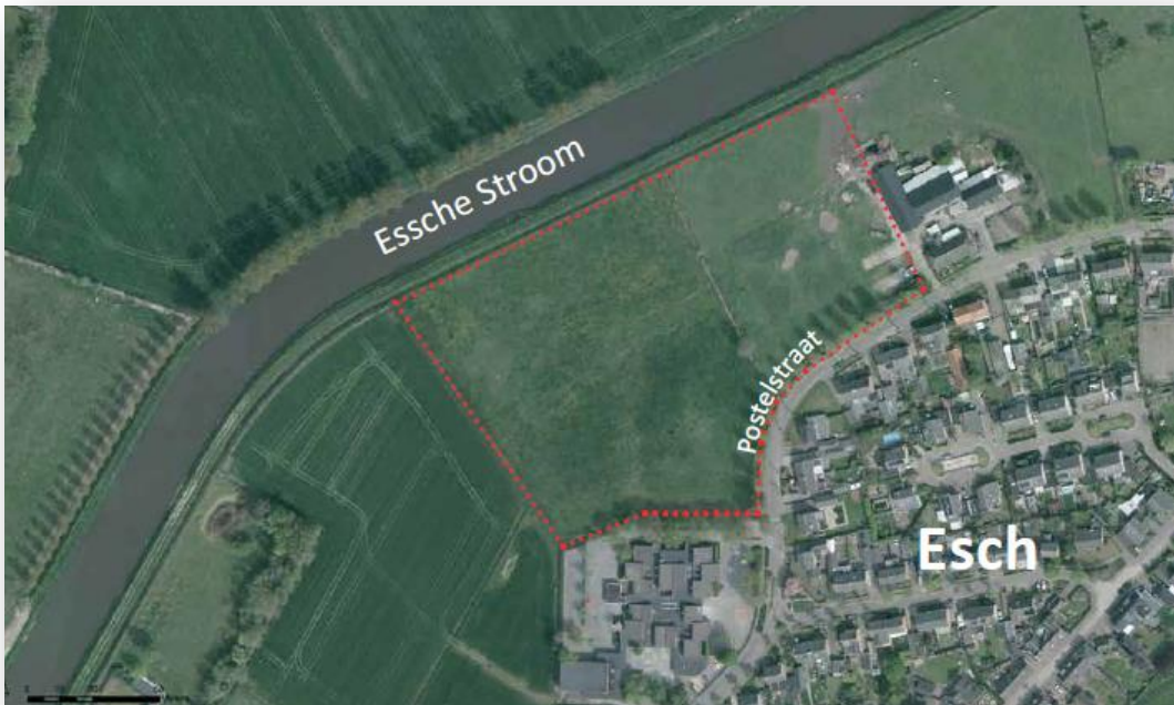
Figuur 2 Begrenzing plangebied, Postelstraat te Esch