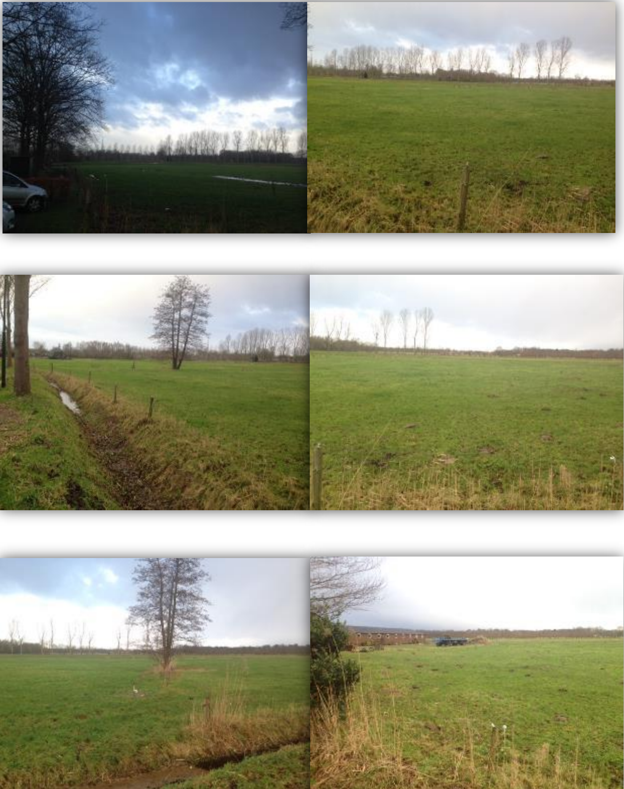
Figuur 3 Foto impressie plangebied