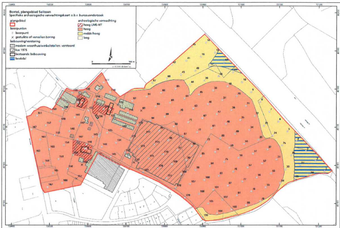
Figuur 2. Verwachtingskaart n.a.v. het bureau- en verkennend booronderzoek.