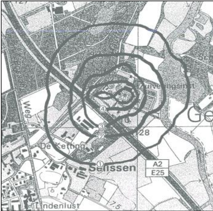
Figuur 2: vergunningcontouren zoals opgenomen in de vergunningaanvraag.

De vergunningcontouren uit de aanvraag zijn gedigitaliseerd en over het beoogde plangebied gelegd. Daarmee wordt inzicht gekregen in de vergunde geurbelasting ter plaatse van het beoogde bouwplan. In figuur 3 zijn de 1 (groen), 2 (oranje) en 3 (rood) geureenheden contouren weergegeven over het bouwplan.