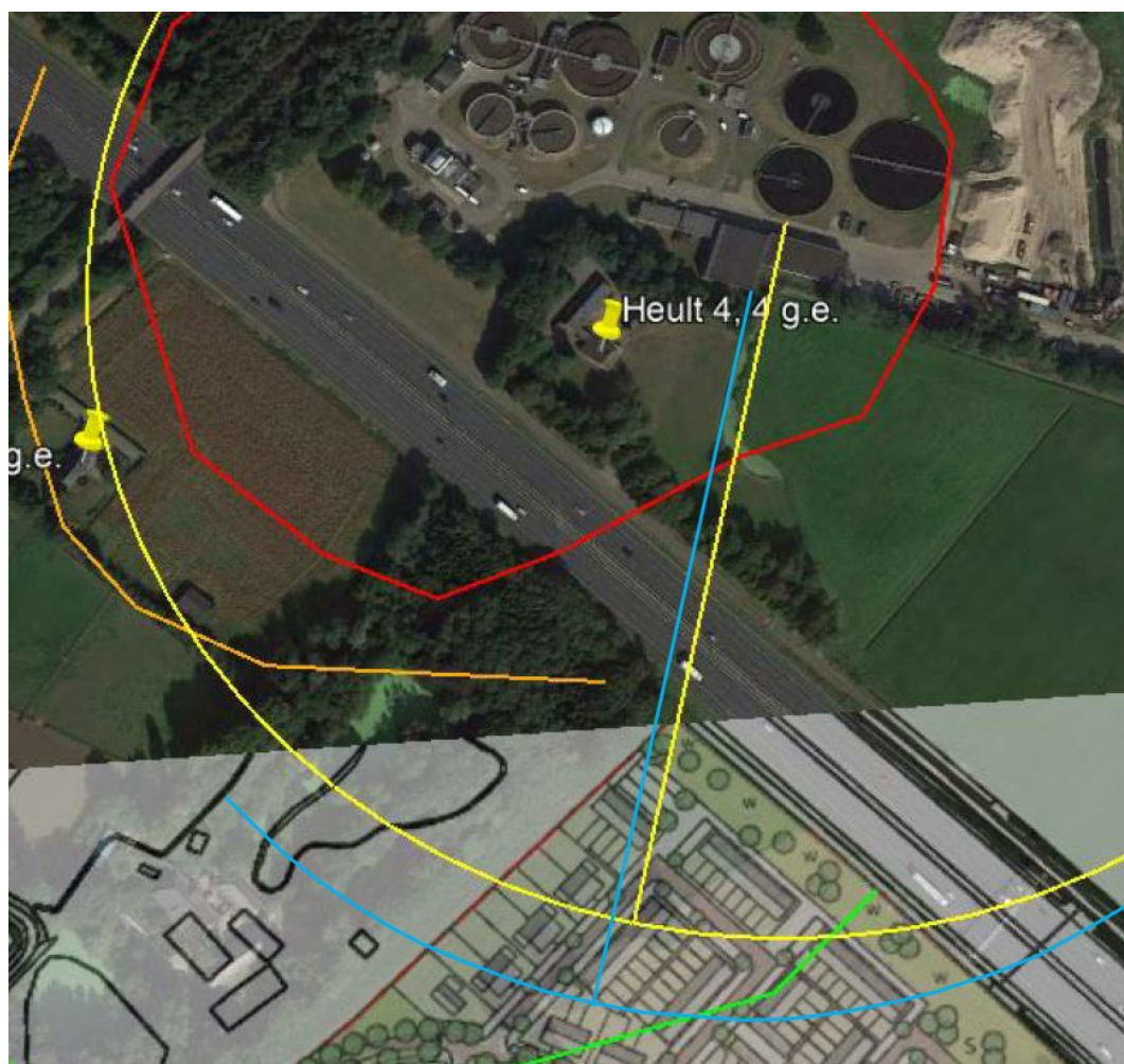
Figuur 4: richtafstand 300 meter vanaf maatgevende installatie (geel) en blauwe contour 300 meter vanaf bestemmingsvlak conform VNG brochure.

De richtafstand voor een zuiveringstechnisch werk bedraagt op basis van de VNG-brochure Bedrijven en Milieuzonering (editie 2009, aangemerkt als ‘RWZI’s’, SBI-code 9001 A1) 300 meter. Indien aan deze 300 meter wordt voldaan is geen aanvullende motivering noodzakelijk voor de beoogde inpassing. In onderstaande figuur is de richtafstand over het plangebied geprojecteerd vanaf de meest nabij gelegen geurrelevante installatie (omdat een toename van de geurbelasting wettelijk is uitgesloten is de richtafstand niet vanaf de inrichtingsgrens gerekend) . Uit de figuur volgt dat slechts een klein deel van het plangebied niet aan de richtafstand voldoet.