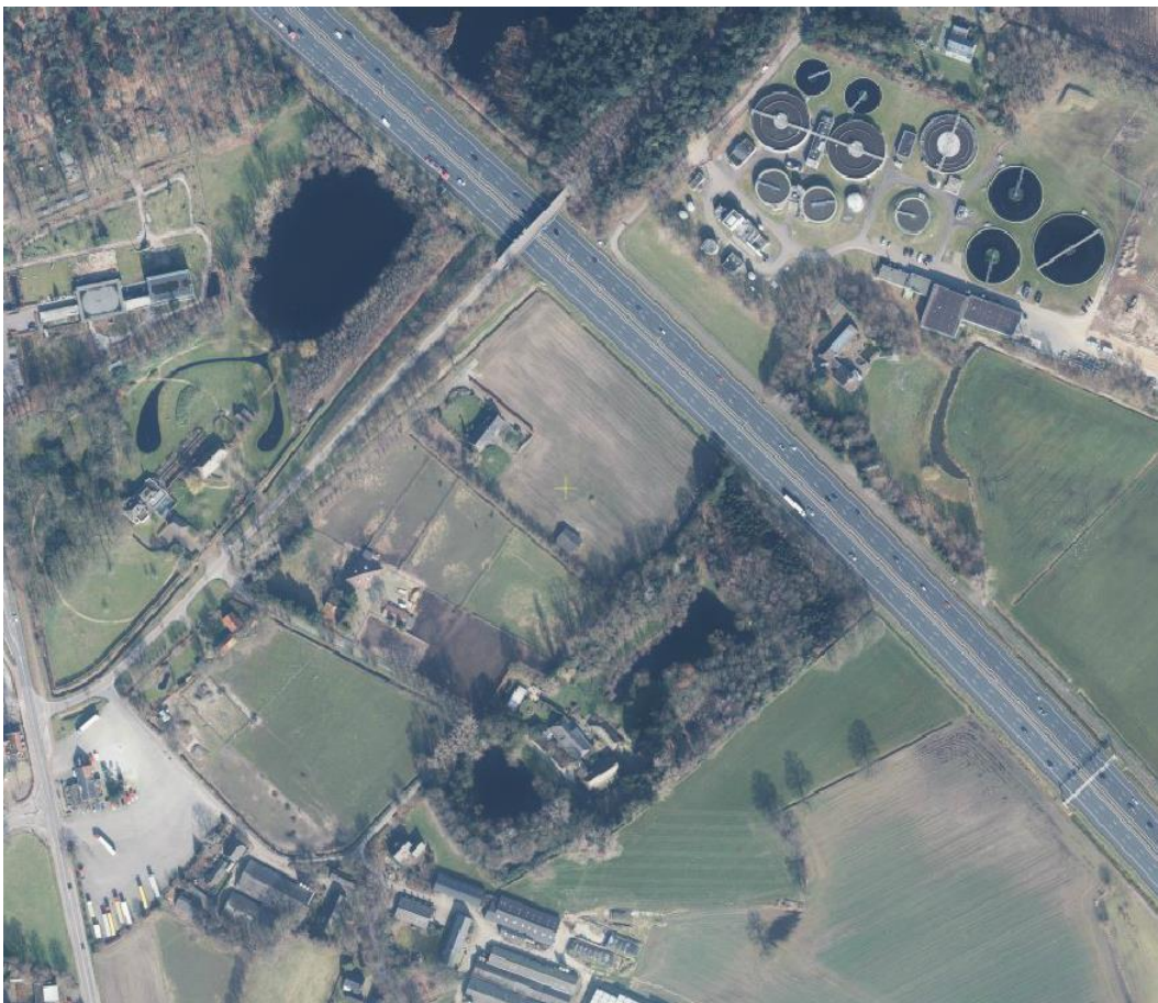
Figuur 1: globale ligging bouwlocatie Selissen

In opdracht van Accent Adviseurs is door Windmill Milieu en Management een beoordeling van het woon- en leefklimaat uitgevoerd voor het aspect geur ten behoeve van de ontwikkeling van een bouwplan te Boxtel. Op de navolgende figuur is de locatie indicatief weergegeven.