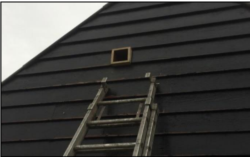
Figuur 3.3. De invliegopening door de gevel van de garage aan de Koolwijksestraat 1