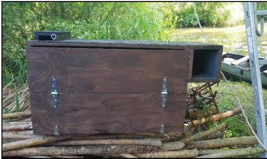
Figuur 3.1 Het type nestkast dat is geplaatst op de Ruiting 3 (Brabants Landschap)