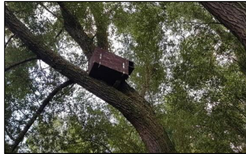
Figuur 3.2 De locatie van de nestkast in een wilg boven de visvijver aan de achterzijde van het perceel van de Ruiting 3