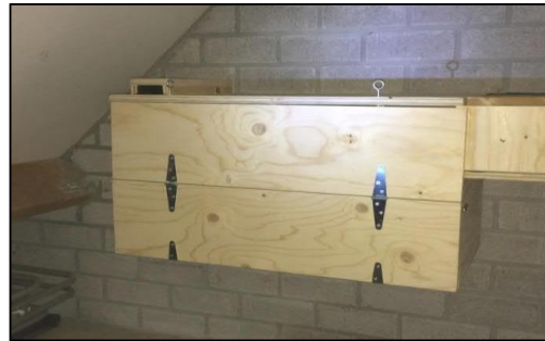
Figuur 3.4. De situering van de kast aan de binnenzijde van de garagezolder Koolwijksestraat 1