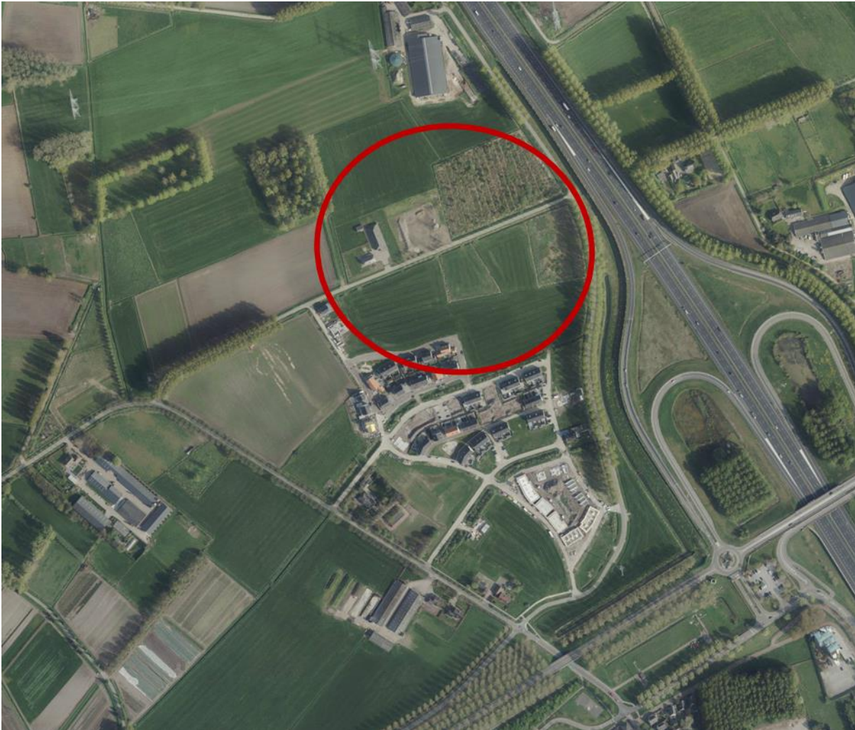
Figuur 1 Locatie plangebied.

De gemeente Best heeft het voornemen de volgende fase van de ontwikkeling van Steegsche Velden in Best vast te leggen in een bestemmingsplan. De fase betreft Steegsche Velden - Noord, waar behalve voor bebouwing, ook ruimte is gereserveerd voor waterberging en een geluidwal welke tevens door wandelaars gebruikt zal worden.