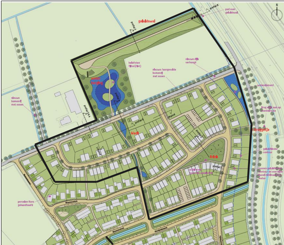
Figuur 3 Voorgenomen eindsituatie binnen het plangebied

Het is vooralsnog niet bekend wat de planning zal zijn voor de voorgenomen werkzaamheden.