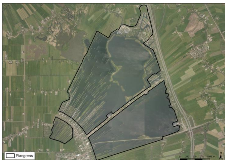
Figuur 1. Overzicht onderzoeksgebied De Vinkeveense Plassen.

Het onderzoeksgebied is afgebakend tot de Vinkeveense plassen. (zie figuur 1). Dit plassengebied grenst aan de kern Vinkeveen in het zuiden. Aan de oostzijde van de plassen loopt van noord naar zuid de snelweg A2, die Amsterdam en Utrecht met elkaar verbindt. Langs het onderzoeksgebied loopt de provinciale weg N201. De provinciale weg 201 is een provinciale weg in de provincies Noord-Holland en Utrecht en heeft een lengte van ruim 56 kilometer. De gehele lengte van de N201 door dit gebied en de A2 zullen hier in beschouwing genomen worden. Gelet op het feit dat enkel de N201 en de A2 hier van belang zijn, en geen sprake is van een nabijgelegen spoor, buisleiding of vervoersroutes over het water die het gebied binnen het invloedgebied van een PR10 -6 contour plaatsen, wordt er enkel gekeken naar het effect van het bestemmingsplan ten aanzien van het vervoer van gevaarlijke stoffen via het wegennetwerk