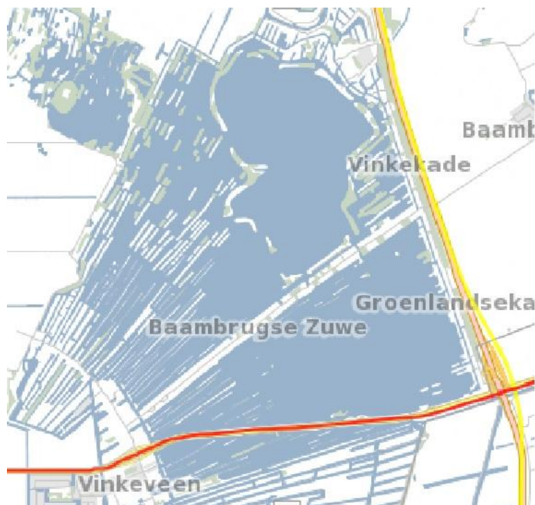
Figuur 3. Overzicht risicokaart waarin het onderzoeksgebied is opgenomen. Er zijn twee transportroutes van gevaarlijke stoffen te identificeren. Tussen de plassen de N201 en aan de oostzijde van noord naar zuid de A2 Amsterdam/Utrecht

Na het raadplegen van de risicokaart en het in kaart brengen van de risico's ten opzichte van de omliggende omgeving rondom de projectlocatie (figuur 3), zijn de volgende risicobronnen die mogelijk invloed hebben op de externe veiligheid, geïdentificeerd: